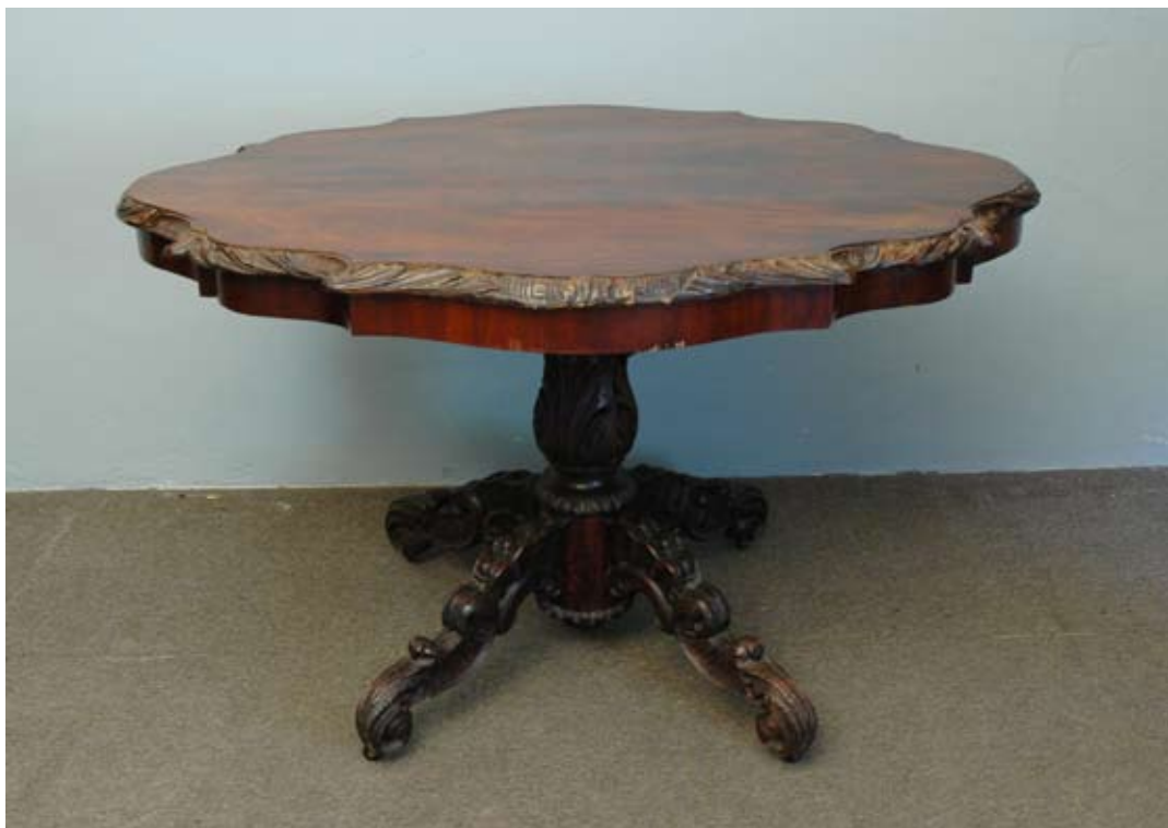
Stół pomocniczy w stylu Ludwika Filipa z blatem zbliżonym do owalu, o falistym zarysie, wspartym na toczonym trzonie, rozwidlonym w czwórnoóg, zakończony rolkami, fornirowany, rzeźbiony. Europa Środkowa, ok. 1860. Mebel wyróżnia dobra jakość snycerki. Podobny stół był wykorzystywany w Sali Balowej zamku nieświeskiego. Dom Aukcyjny Rempex, Aukcja 124, nr. 813, cena wywoławcza 8000 zł

inwentarz pochodzi dopiero z 1920 r. i jest przechowywany w zbiorach białoruskich 51 . Inwentarze pisane rozszerzają pogląd o wnętrzach. Po pierwsze dają zwykle dokładniejsze wykazy przedmiotów w nich zgromadzonych, również takich, których na fotografiach nie dostrzeżemy. Często spisywane w obecności właścicieli wskazują ich osobisty, sentymentalny stosunek do konkretnych obiektów. Rzadziej podają prawdziwe informacje o obiektach, o ich historii czy pochodzeniu, częściej natomiast przekazują opinię, można by ją nazwać – „legendarną”, czyli taką, jaką im o nich przekazano w rodzinie lub przy nabyciu. Te informacje, choć nieprawdziwe również są bardzo ważne dla nas współcześnie, pozwalają odczuć nigdzie nie zapisaną atmosferę epoki. Mam nadzieję, że w przyszłości będę mogła uzupełnić „fotograficzną wiedzę” o wnętrzach zamku nieświeskiego z inwentarzami pisanymi.