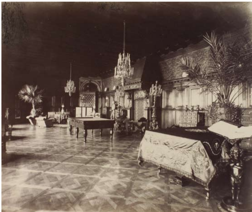
Wielka Jadalnia w zamku nieświeżskim, foto. J. Boretti, 1894, ze zbiorów Muzeum Narodowego w Warszawie, syg. DI 54759/45

ło się z wielu połączonych ze sobą budynków. W głębi dziedzińca, na wprost budynku bramnego, stał czworoboczny, kilkupiętrowy gmach. Na parterze mieściła się sień, a także duża klatka schodowa wiodąca na piętro do umieszczonych po jej lewej i prawej stronie, skomunikowanych amfiladowo pokoi pana i pani domu. Na drugim piętrze ulokowano zbrojownię. Budynek ten połączono w południowo-zachodnim narożniku z ustawionym ukośnie prostokątnym i jednoprzestrzennym, niewielkim budynkiem mieszczącym m.in. dawną galerię portretów, wykorzystywaną w XX w. jako Wielką Jadalnię oraz położoną nad nią Salę Myśliwską. Właściwy i najstarszy korpus zamkowy stał w południowej części dziedzińca, był prostokątny, rozległy, wielodzielny i tak jak ukośny łącznik, trzypiętrowy. W nim ulokowano m. in Salę Balową, zwaną Białą. We wszystkich z tych części mieściły się poza tym apartamenty rodziny oraz pokoje gościnne.