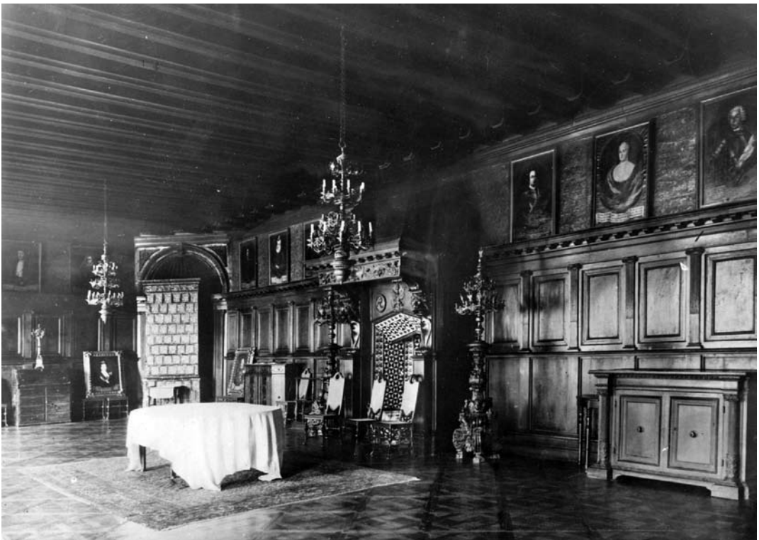
Wielka Jadalnia w zamku nieświeskim, foto. ok. 1932, ze zbiorów Narodowego Archiwum Cyfrowego, syg. 1-U-4285-3