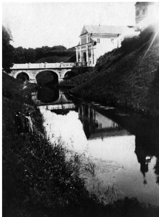
Zamek w Nieświeżu, zdjęcie od strony kanału, ok. 1924; ze zbiorów NAC, sygn. 1 – U – 4282

Uzupełniająco do celów identyfikacyjnych posłużyć mogą zdjęcia wykonane po I wojnie światowej. Zdjęcia z Narodowego Archiwum Cyfrowego pochodzą ze zbiorów archiwalnych Ilustrowanego Kuriera Codziennego z początku lat 30. XX w. 13 Większość to zdjęcia przedstawiające zamek i elementy jego architektury, a tylko cztery z nich przedstawiają wnętrza: kaplicę, salę jadalną (galeria portretów), salonik (Sala Balowa) oraz salę myśliwską 14 . Fotografie zgromadzone w fototece Instytutu Sztuki PAN wykonane w latach 1918-1939 przez różnych fotografików (m.in. fotografika nieświeskiego Obuchowskiego w 1927 r. 15 i Adama Bochnaka sprzed 1939 r. 16 ), jak w opisanych wyżej zbiorach przedstawiają zarówno budynek zamkowy, jak również jedno z wnętrz – salę kominkową (Wielka Jadalnia, zdjęcie z ok. 1923 r.) oraz zbiór portretów rodzinnych w niej umieszczonych 17 .