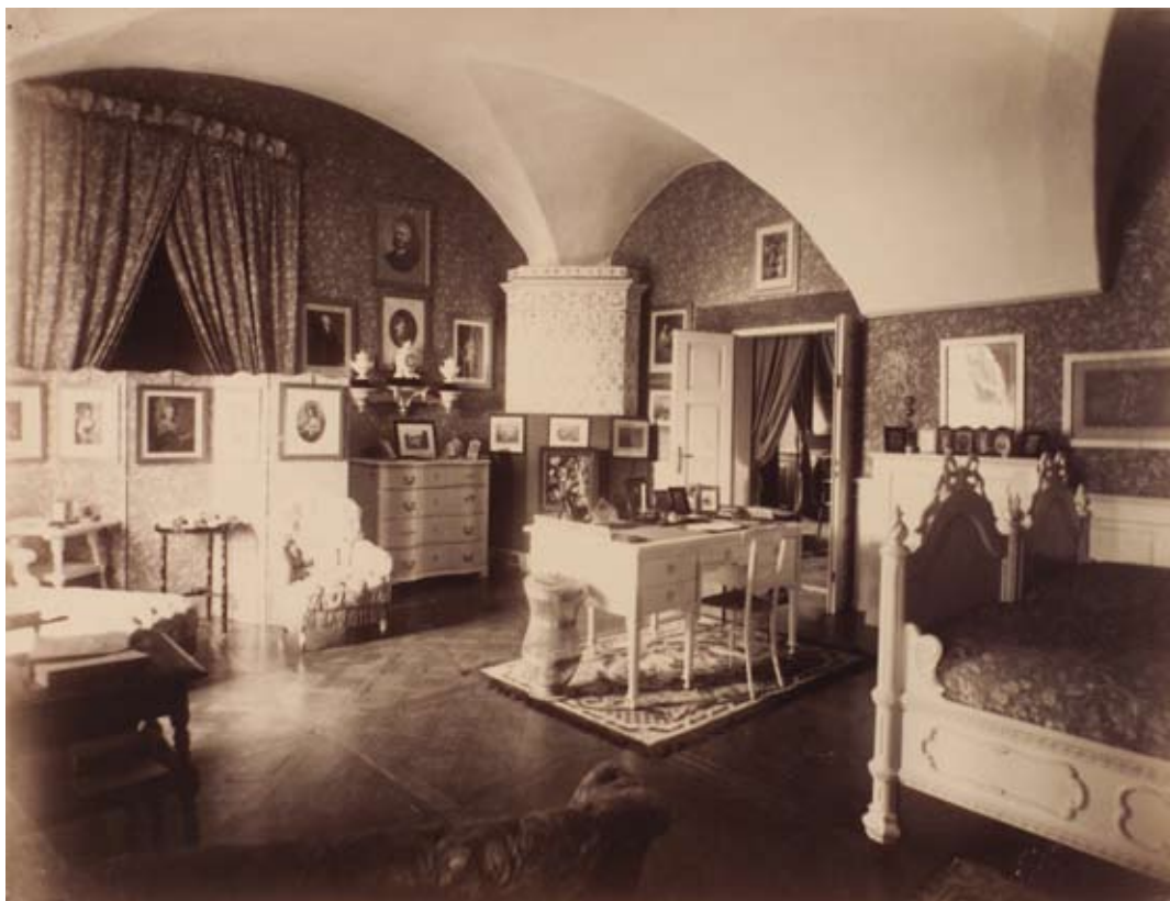
Sypialnia w zamku nieświeskim, foto. J. Boretti, 1894, ze zbiorów Muzeum Narodowego w Warszawie, syg. DI 54759/43

ale także rodziny i gości (duży stół do podawania posiłków, bilard do gry, kanapa i fotel do odpoczynku).