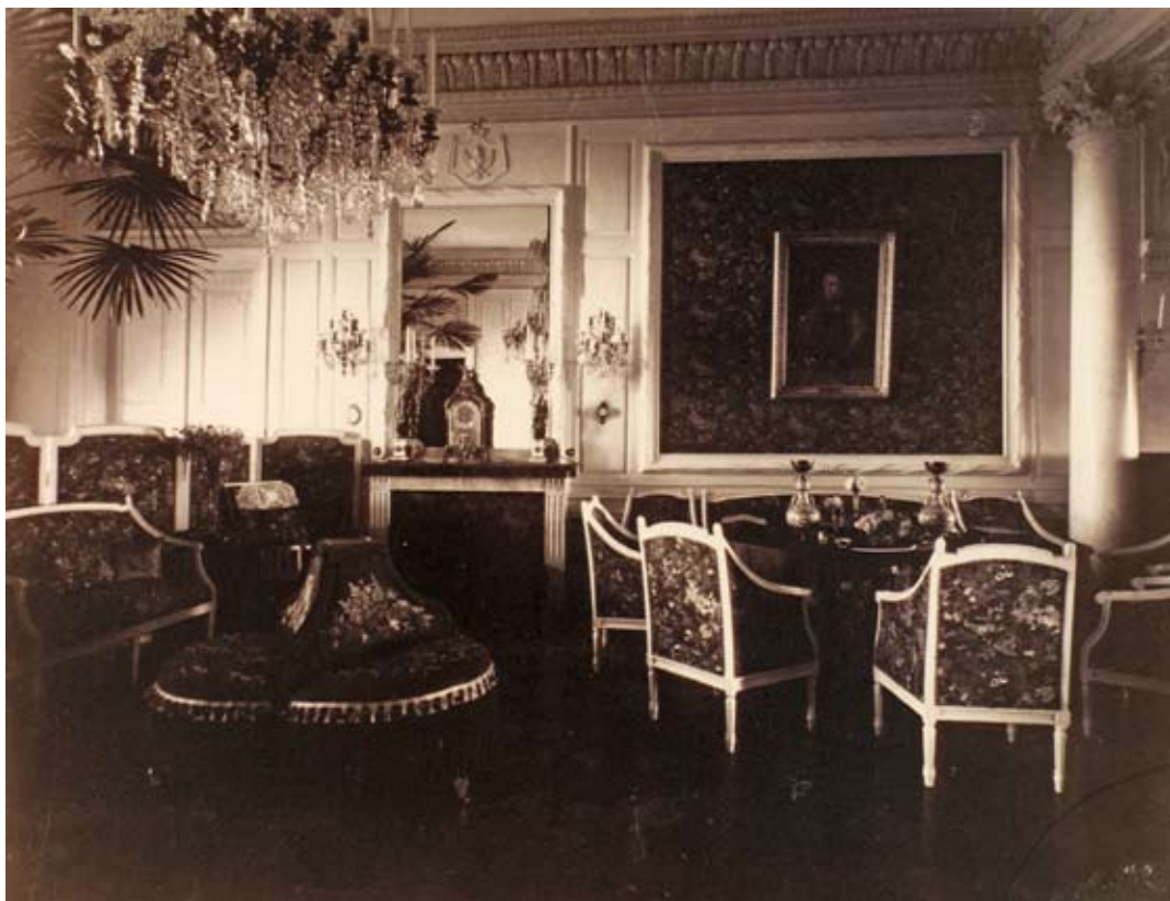
Sala Balowa w zamku nieświeckim, foto. J. Boretti, 1894, ze zbiorów Muzeum Narodowego w Warszawie, sygn. DI 54759/40

Stollenschrank 23 , a po lewej meble z końca XIX w. - neorenesansowe proste fotele 24 i stolik pomocniczy 25 . Dwubiegowa klatka schodowa, dekorowana trofeami myśliwskimi, prowadziła na piętro do dwóch amfiladowych ciągów pomieszczeń wykorzystywanych przez księżną (po prawej stronie) i księcia (po lewej stronie). Jasne oraz dekorowane kwiatami i licznymi bibelotami pokoje pani były wyposażone lekkimi rokokowymi i klasycystycznymi meblami (rzeźbionymi, pozłacanymi i fornirowanymi różą, palisandrem i mahoniem, a ozdobione mosiężnymi okuciami), być może francuskiego pochodzenia, wykonane w końcu XVIII i w końcu XIX w.. Pokoje pana domu charakteryzowała reprezentacyjność z pocz. XIX (dominowały meble empirowe wykonane z mahoniem i dekorowane mosięż-