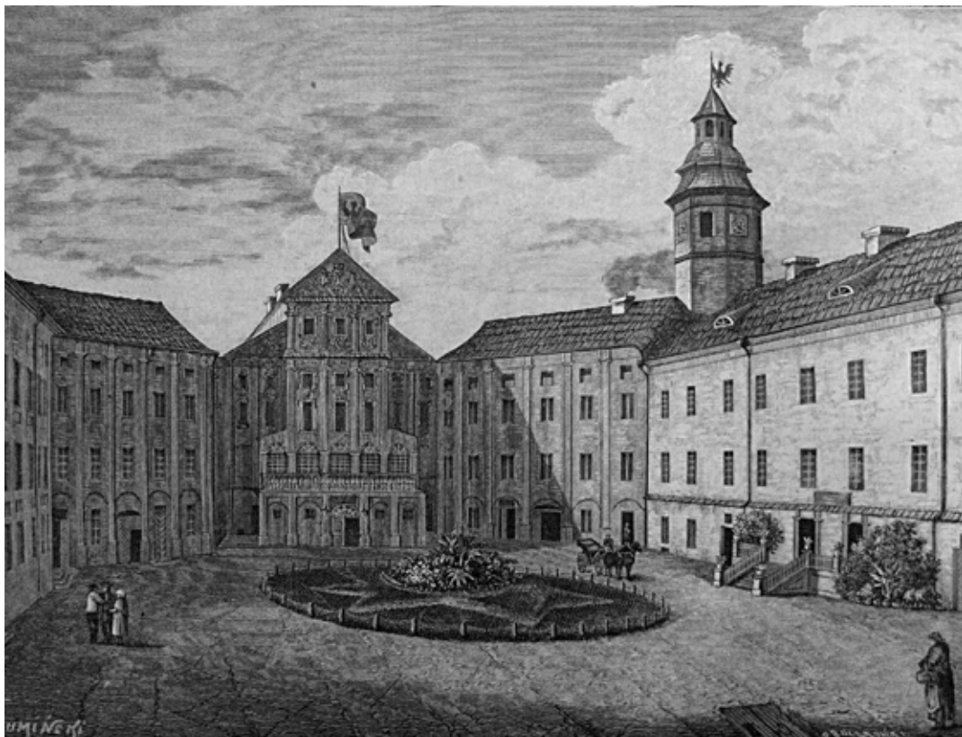
Dziedziniec zamku w Nieświeżu, rys. Wł. Gumiński, „Tygodnik Ilustrowany”, nr 326, s. 184

Należy podkreślić, że identyfikacja obiektów ze zdjęć jest trudna. Wymaga dużego opatrzenia. Znajomości zarówno identyfikowanych obiektów z praktyki, jak i wiedzy o epoce w której zostały wykonane lub były wykorzystywane. Powinna odbywać się tylko w sytuacjach szczególnych, np. zaginięcia oryginału czy jego zniszczenia. Stąd też, ponieważ od wielu lat zajmuję się meblami zabytkowymi i tylko ta część wiedzy o sztuce użytkowej jest mi bliżej znana, ograniczę się do oceny wnętrza zamku nieświeskiego tylko pod względem wyposażenia meblowego, pozostałą aranżację potraktuję marginalnie. Zwykle zresztą meble stanowią clou aranżacyjne i określają klimat wnętrza, uzupełniane obrazami, tkaninami, ceramiką i pamiątkami.