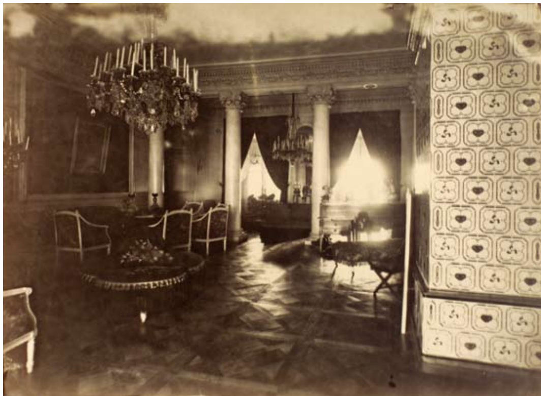
Sala Balowa w zamku nieświeżskim, widok na kolumnadę, 1894, syg. DI 54759/41

nych pomieszczeniach, ulokowano również pokoje gościnne i apartamenty mieszkalne 34 . Miały one zwykle wyposażenie klasycystyczne i eklektyczne w duchu angielskim 35 .