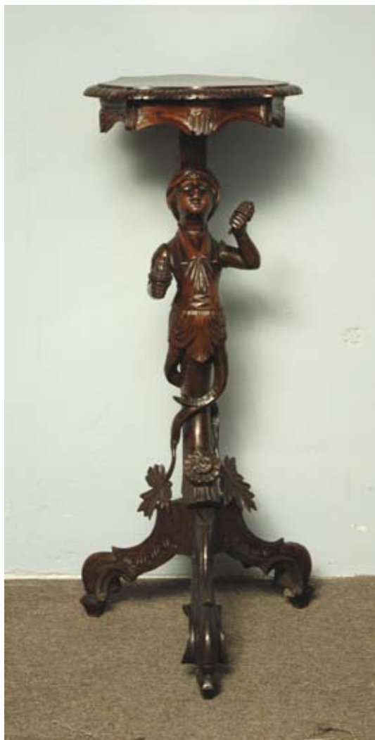
Postument eklektyczny z niewielkim blatem o falistym obrzeżu, podtrzymywany przez popiersie młodego chłopca w turbanie, wspartego na esowatym trójnogu dekorowanym rzeźbionymi kwiatami i ceownicami. Postument eklektyczny Europa zachodnia (Północne Włochy?), 4 ćw. XIX w. Ciekawy, niewielki postument, powstały na fali mody na orient i egzotykę, typowy wytwór 4 ćw. XIX w., jakich sporo było w pałacach polskiej arystokracji. W nieświeskiej Wielkiej Jadalni wykorzystywano niezwykle podobny stojak do nut. Dom Aukcyjny Rempex, Aukcja 130, nr. 721, cena wywoławcza 5000 zł

Od 2001 r. trwają intensywne i gruntowne prace budowlane – adaptacyjne. Obiekt, według obecnej koncepcji zagospodarowania, będzie pełnił kilka funkcji: obok już otwartych dla zwiedzających sali historycznej i odtworzonej sali archiwum, powstanie tu muzeum wewnątrz, centrum konferencyjne, restauracja i hotel. Ministerstwo Kultury i Dziedzictwa Narodowego od kilku lat współpracuje ze stroną białoruską w kwestii odnowienia zamku w Nieświeżu i przywrócenia go dawnej świetności. Mam nadzieję, że już niedługo Nieśwież znowu zachwyci pięknymi wnętrzami.