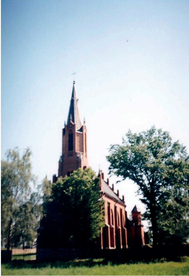
5. Kościół w Dereczynie. Fot. T. Krahel, 1998 Church in Dereczyn. Photo: T. Krahel, 1998

Nie mogąc z tak niedużą garstką parafian zbudować kościoła, kwestuję najczęściej pod kościołami w Wilnie, objeżdżam Moskwę, Petersburg, Charków, Kijów i inne miasta Rosyji i Kongresówki – w ten sposób powoli wznoszę mury świątyni. Rozszerzam jednocześnie akcję kulturalno-oświatową: zakładając potajemnie szkoły polskie i biblioteczki. Przez nawracanie prawosławnych i tworzenie szkółek polskich narażam się rządowi rosyjskiemu i popom. Rozpoczynają się śledztwa i sądy (trzy razy sądy okręgowe, z których jeden mi grozi trzyletnim więzieniem – krepości). Placę grzywny i odsiaduję zamiast więzienia – klasztor u franciszkanów w Grodnie 9 . Rząd wyrzuca mię z Dereczyna bez prawa być proboszczem ani też wikarym 10 .