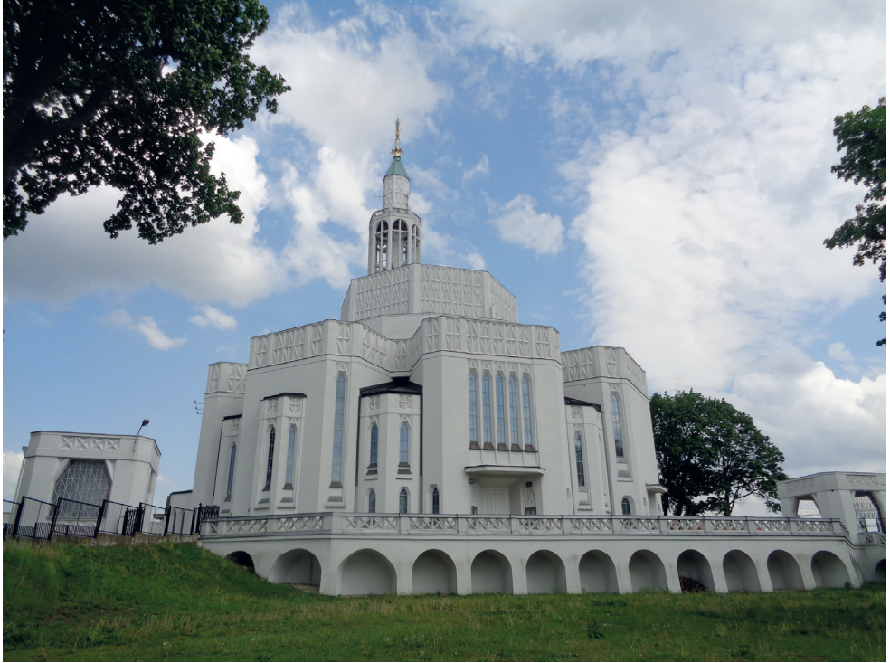
9. Kościół św. Rocha, widok od strony zachodniej. Fot. T. Krahel, 2019 Church of St. Roch, view from the western side. Photo: T. Krahel, 2019

Sióstr Misjonarek św. Rodziny, siostry zamieszkały w tym budynku i opiekowały się przebywającymi tam pensjonariuszami. W tym domu oprócz części przeznaczony dla starców były też mieszkania dla księży, służby kościelnej, sala parafialna oraz jedno piętro przeznaczone dla sióstr zakonnych, które prowadziły tam kursy krawieckie 47 .