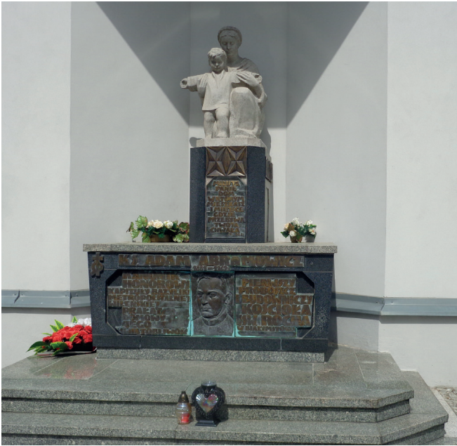
11. Grób ks. A. Abramowicza przy kościele św. Rocha. Rzeźba Matki Boskiej z Dzieciątkiem, S. Horno-Popławski. Fot. T. Krahel, 2019 Grave of Rev. A. Abramowicz in the grounds of the church of St. Roch. Statue of the Madonna and Child, S. Horno-Popławski. Photo: T. Krahel, 2019