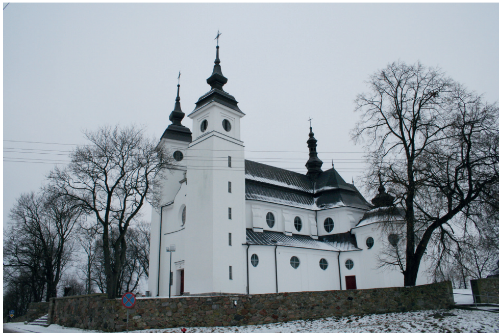
← 6. Kościół w Uhowie. Fot. T. Krahel, 2019 Church in Uhowo. Photo: T. Krahel, 2019