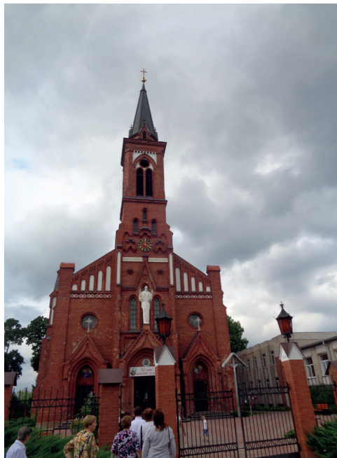
3. Kościół w Postawach. Fot. T. Krahel, 2018 Church in Postawy. Photo: T. Krahel, 2018