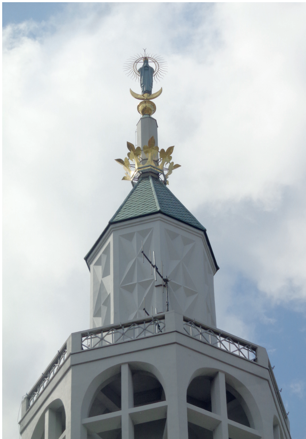
10. Kościół św. Rocha, figura Matki Boskiej Królowej na wieży. Fot. T. Krahel, 2019 Church of St. Roch, figure of the Madonna, Queen of Poland on the tower. Photo: T. Krahel, 2019