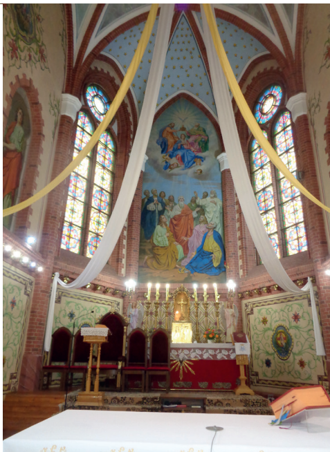
4. Kościół w Postawach, widok wnętrza ku prezbiterium. Church in Postawy, view of the interior towards the presbytery.