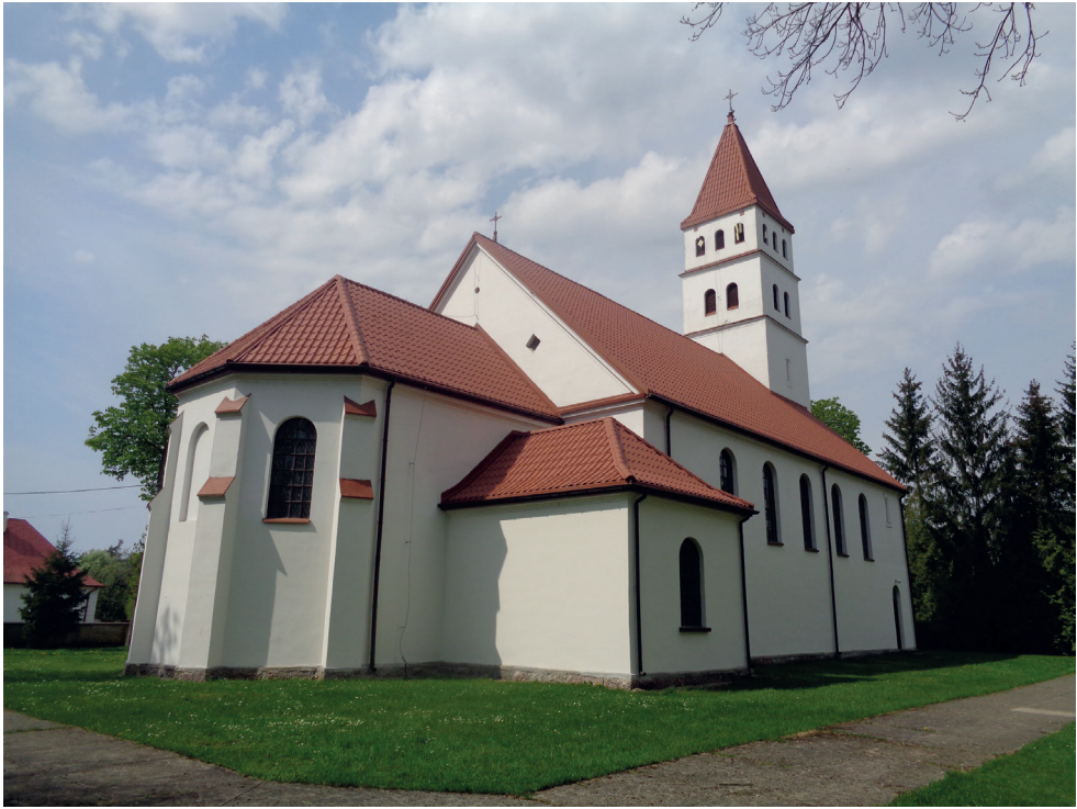
8. Kościół w Downarach. Church in Downary.

ła na cmentarzu grzebalnym św. Rocha. Po II wojnie światowej ks. Abramowicz, po uzyskaniu pozwolenia na ekshumację szczątków swego ojca, przewiózł je do Białegostoku i pochował przy grobie swojej matki Cecylii 25