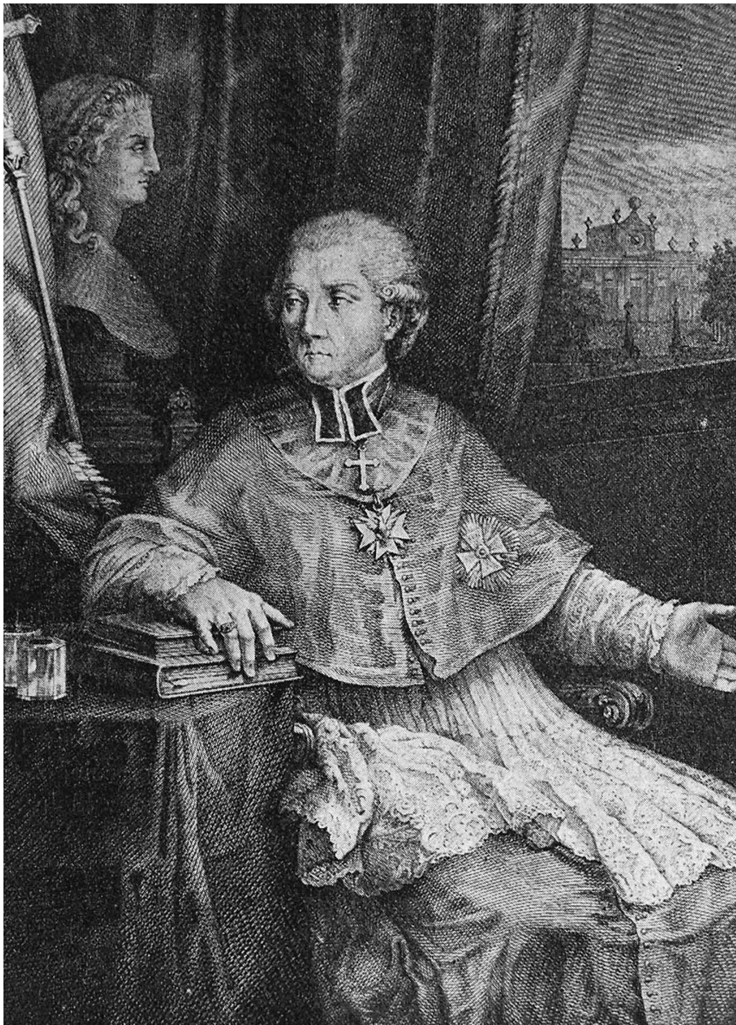
Il. 7. Józef Wall (?) Portret prymasa Michała Poniatowskiego, 1790. ol., pł., 136 x 98, Muzeum Sztuki w Krasnojarsku.