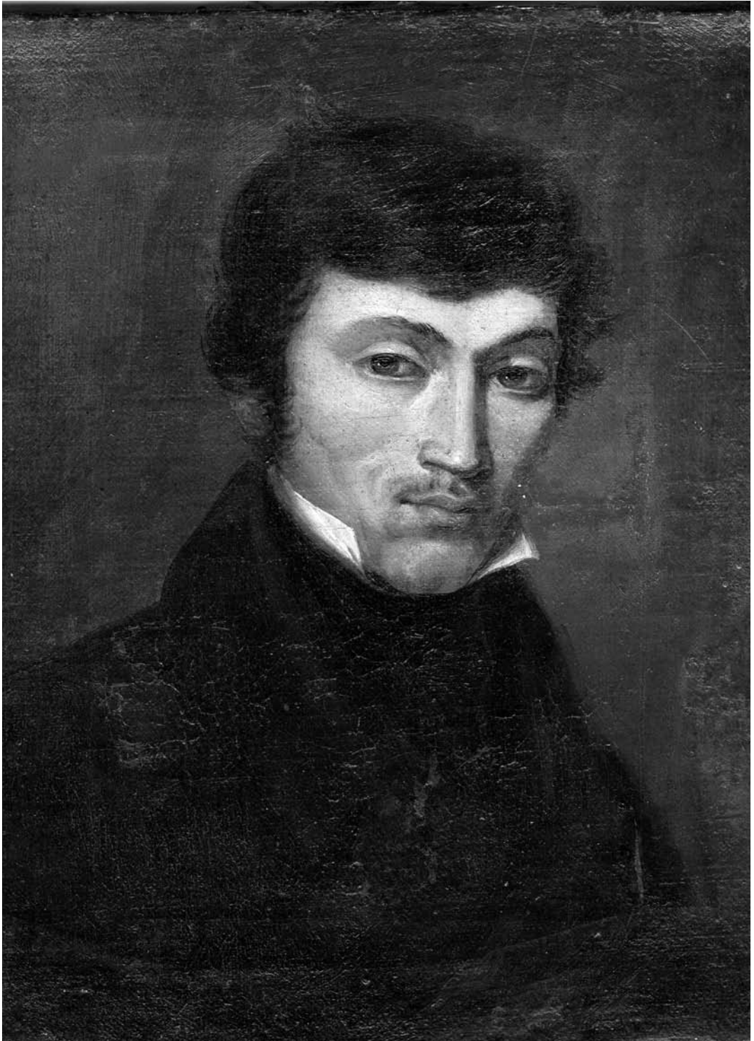
Il. 9. Walenty Wańkiewicz (?). Portret Adama Mickiewicza w młodości, ok. 1823 r. ol., pł., 26,4 x 21,1, GIM nr inw. 8300/II 5800.