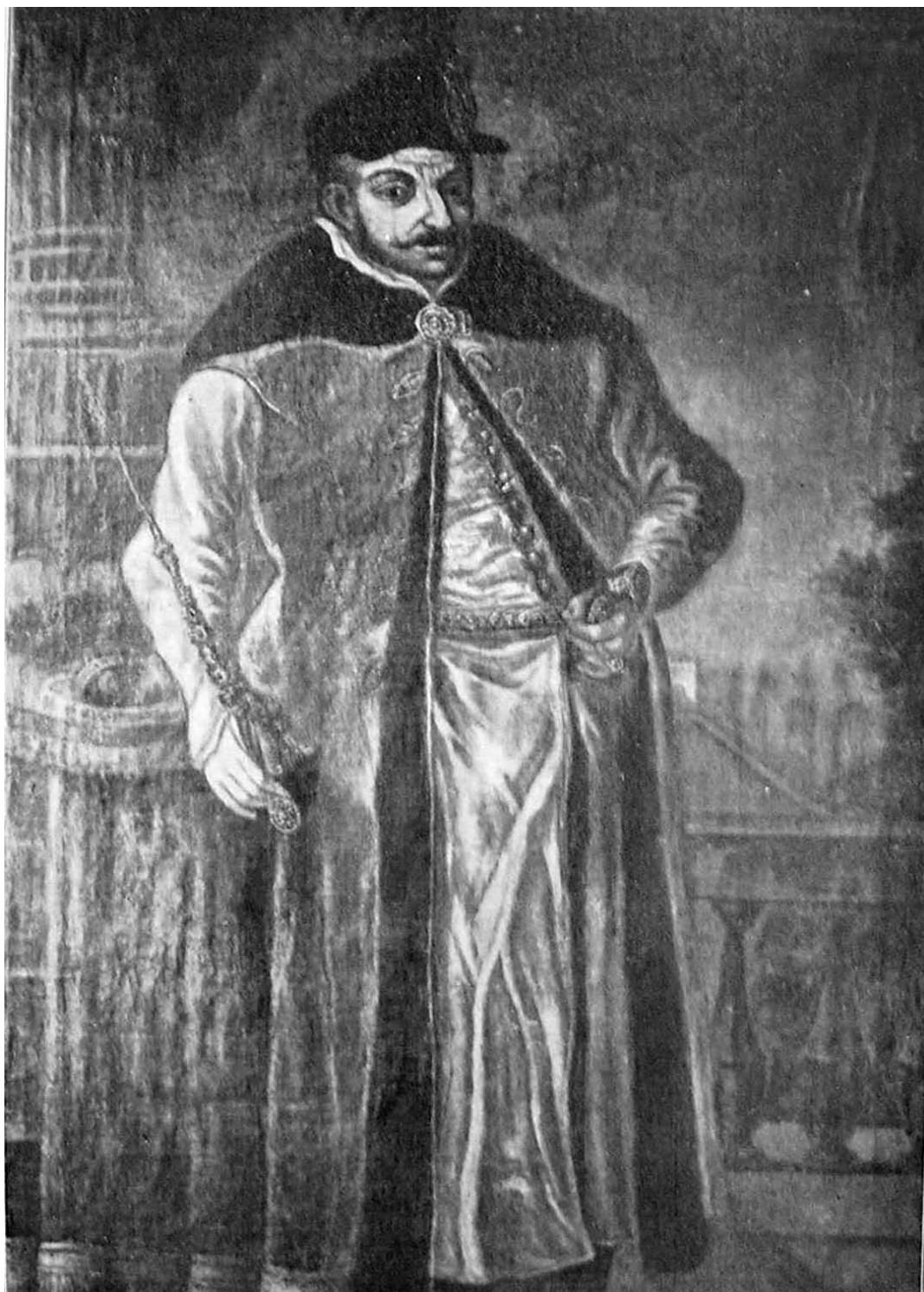
Il.1. Malarz nieznan. Portret Stefana Batorego, k. XVII-1. poł. XVIII w. ol., pł., 204 x 114, GIM nr inw. 74493/MI 4216. Reprodukcyj: B. Милуоту, op. cit.