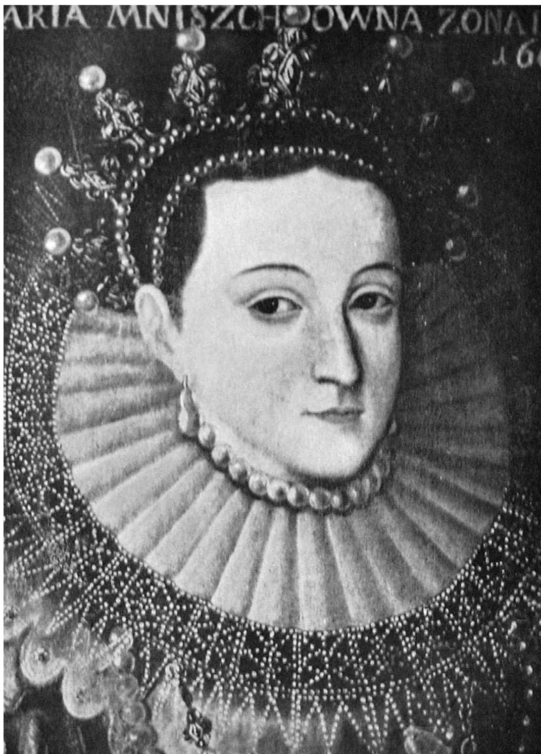
Il. 5. Malarz nieokreślony. Portret Maryny Mniszchówny, kopia z 2. poł. XIX w. ol., pł., 47 x 37, LNM, nr inw. T-283.. Reprodukcja: B. Милуому, op. cit. , il. s. 36.