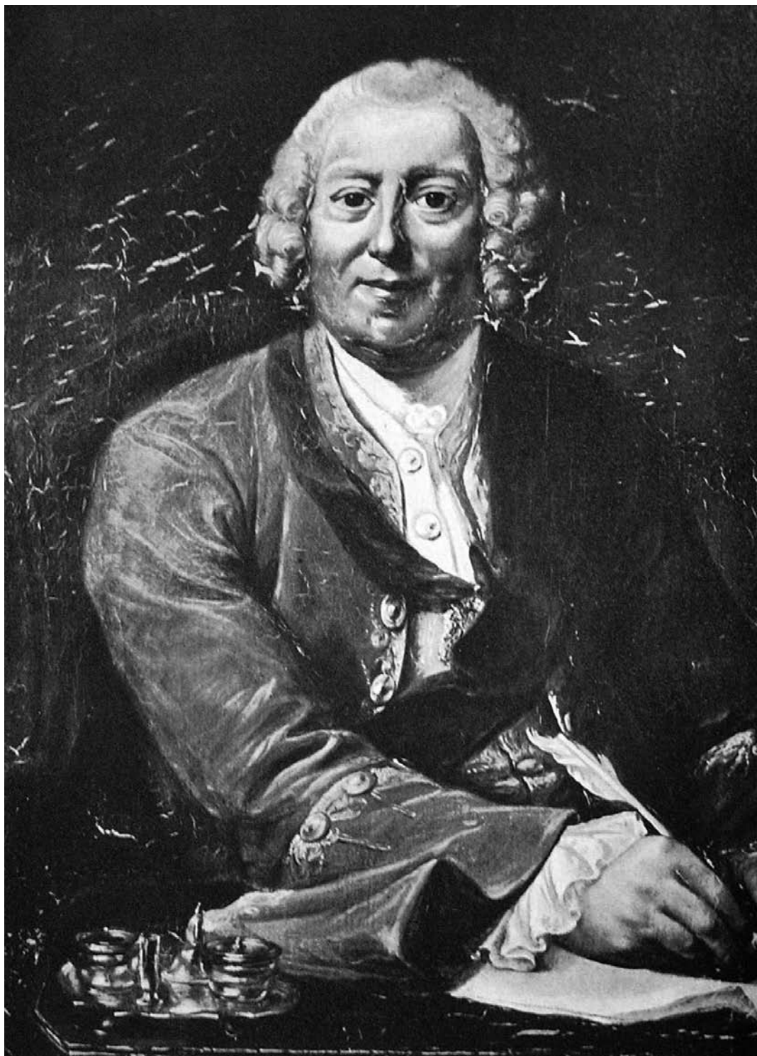
Il. 8. Malarz nieokreślony. Portret Jana Jerzego Flemminga, lata 60-te XVIII w. ol., pł., 74 x 55, lokalizacja nie ustalona.