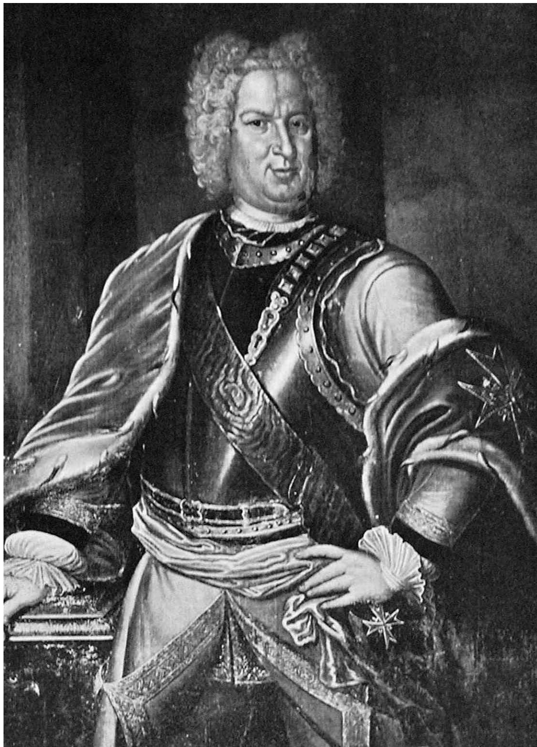
Il. 4. Malarz nieokreślony. Portret Stanisława Leszczyńskiego, 1. tercja XVIII w. ol., pł., 125,5 x 99, GIM nr inw. 74493/VI – 4198. Reprodukacja: B. Munuomu, op. cit., il. s. 13.