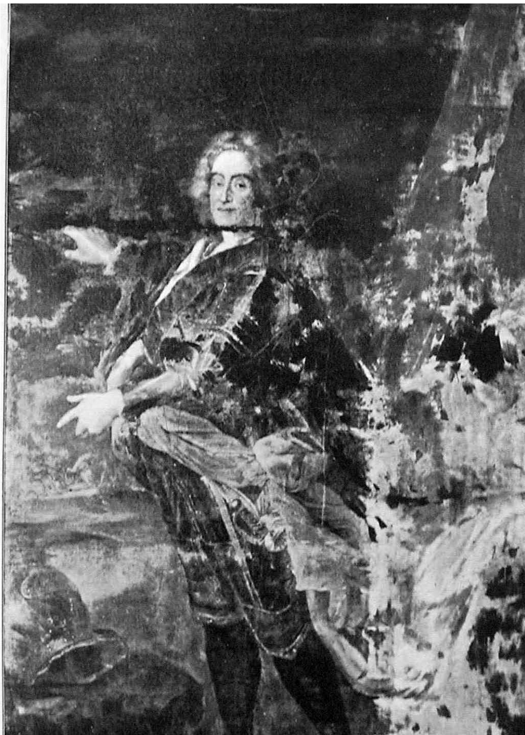
Il. 3. Malarz nieokreślony (warsztat A. Pesne'a?). Portret Augusta II Mocnego, po 1710. ol., pł., 275 x 150, GIM nr inw 93888/VI 5444. Reprodukcja: B. Munuomu, op. cit., il. s. 8.