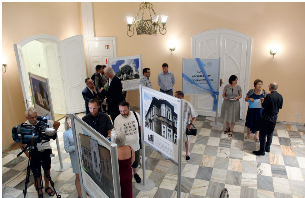
4. Otwarcie wystawy „Obiekty modernistyczne województwa podlaskiego” w WUOZ w Białymstoku Opening of the exhibition: “Modernist objects in the voivodeship of Podlasie” at WUOZ in Białystok

Ważnym wydarzeniem związanym z dotacjami Podlaskiego WKZ na zabytki w roku 2019 było uroczyste wręczenie umów właścicielom zabytków. W dniu 26 czerwca w siedzibie Wojewódzkiego Urzędu Ochrony Zabytków w Białymstoku zostały podpisane umowy z osobami, które otrzymały to wsparcie. Dotacja została podzielona, w różnych kwotach, między 53 podmioty. Podlaski WKZ zwrócił uwagę na fakt, że zostały dofinansowane „bardzo różne zabytki. Najwięcej środków przeznaczaliśmy na zabytki sakralne, zarówno kościoły katolickie, jak i cerkwie – dlatego że stanowią one najwyższy odsetek zabytków w województwie podlaskim, ale również dofinansowaliśmy obiekty prywatne”.