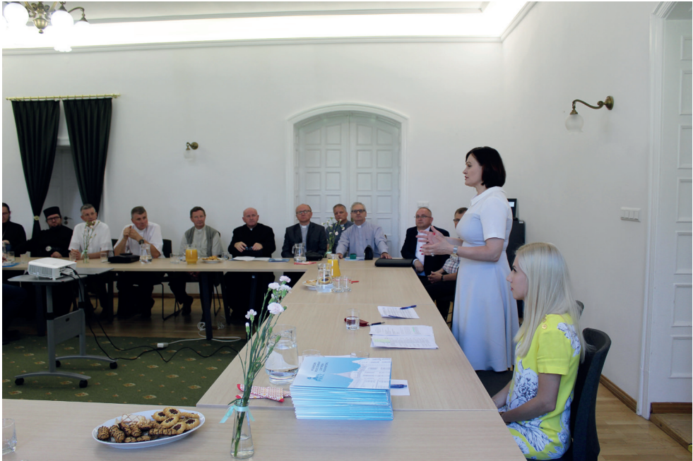
5. Uroczyste wręczenie umów dotacyjnych PWKZ właścicielom zabytków Ceremony of the presentation of the Podlaskie Voivodeship Conservator of Monuments grant agreements to owners of historical monuments

kim Urzędzie Ochrony Zabytków w Białymstoku i jego delegaturach w Łomży i w Suwałkach.