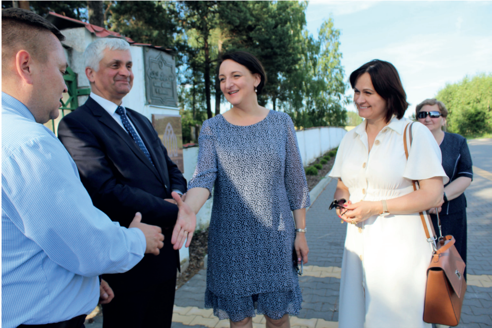
3. Dzień ogłoszenia decyzji o utworzeniu pierwszego w województwie podlaskim Parku Kulturowego w Bohonikach Day of the announcement of the Cultural Park in Bohoniki, the first in the voivodeship of Podlasie