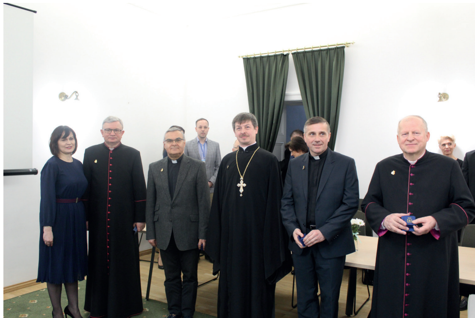
2. Uroczystość wręczenia złotych odznak „Za opiekę nad zabytkami” w WUOZ w Białymstoku Ceremony of presenting golden badges "For the Protection of Historical Monuments" at WUOZ in Białystok