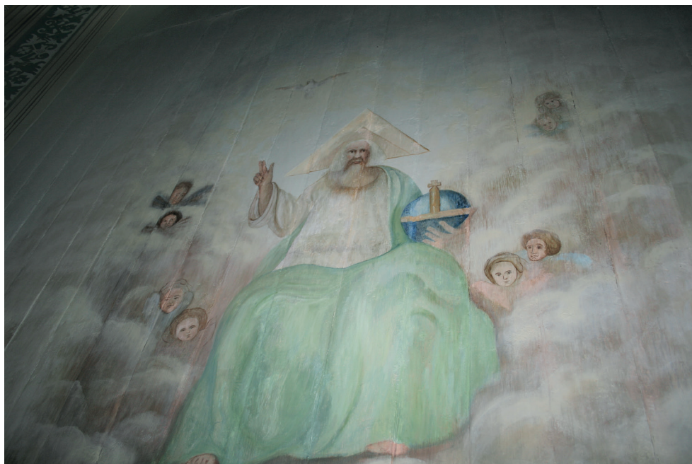
13. Turośl. Kościół pw. św. Jana Chrzciciela. Prace konserwatorskie przy polichromii stropu. Bóg Ojciec po konserwacji, 2018.

W części środkowej stropu, przy chórze, odsłonięty podczas badań fragment postaci okazał się przedstawieniem Boga Ojca ukazanego jako starzec trzymający w prawej dłoni jabłko królewskie, symbolizujące kulę ziemską zwieńczoną złotym krzyżem. Bóg przedstawiony jest w pozycji siedzącej, w zielonym płaszczu, spod którego widać białą szatę ze złotymi wykończeniami. Lewą rękę ma uniesioną w geście błogosławieństwa. Tło kompozycji dekorującej strop utrzymane jest w tonacji szaroniebieskiej. Tło przechodzi w części zbliżonej do postaci Boga w chmury, z których wylaniają się główki aniołków i gołębicę symbolizującą Ducha Świętego.