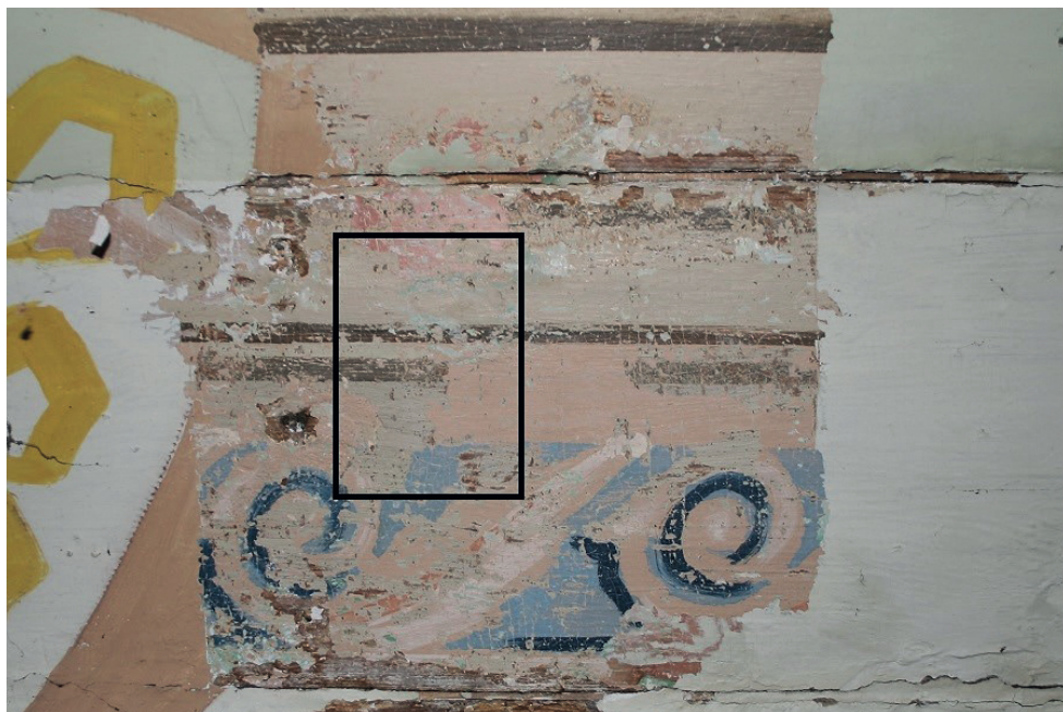
6. Turośl. Kościół pw. św. Jana Chrzciciela. Prace konserwatorskie przy polichromii stropu, centralnie widoczna najstarsza polichromia z lat siedemdziesiątych XIX w., 2016. Turośl. Church of St. John the Baptist. Conservation of ceiling polychrome, in the centre: the oldest polychrome from the 1870s, 2016.

kościół. Wtedy to powstały podmalowania przedstawień po formie, podmalowania tła beżowo-brązowych paskowań oraz zamalowanie nowymi motywami ornamentalnymi części fryzu faset.