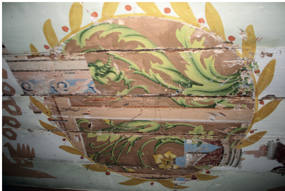
9. Turośl. Kościół pw. św. Jana Chrzciciela. Polichromia stropu, czwarta warstwa chronologiczna znajdująca się pod warstwą z 1971 r., 2015. Turośl. Church of St. John the Baptist. Ceiling polychrome, fourth chronological layer beneath a layer from 1971, 2015.