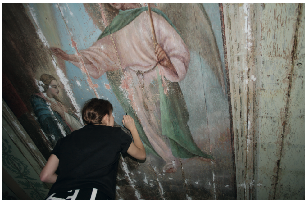
12. Turośl. Kościół pw. św. Jana Chrzciciela. Prace konserwatorskie przy polichromii stropu.

Turośl. Church of St. John the Baptist. Conservation of ceiling polychrome, 2018.