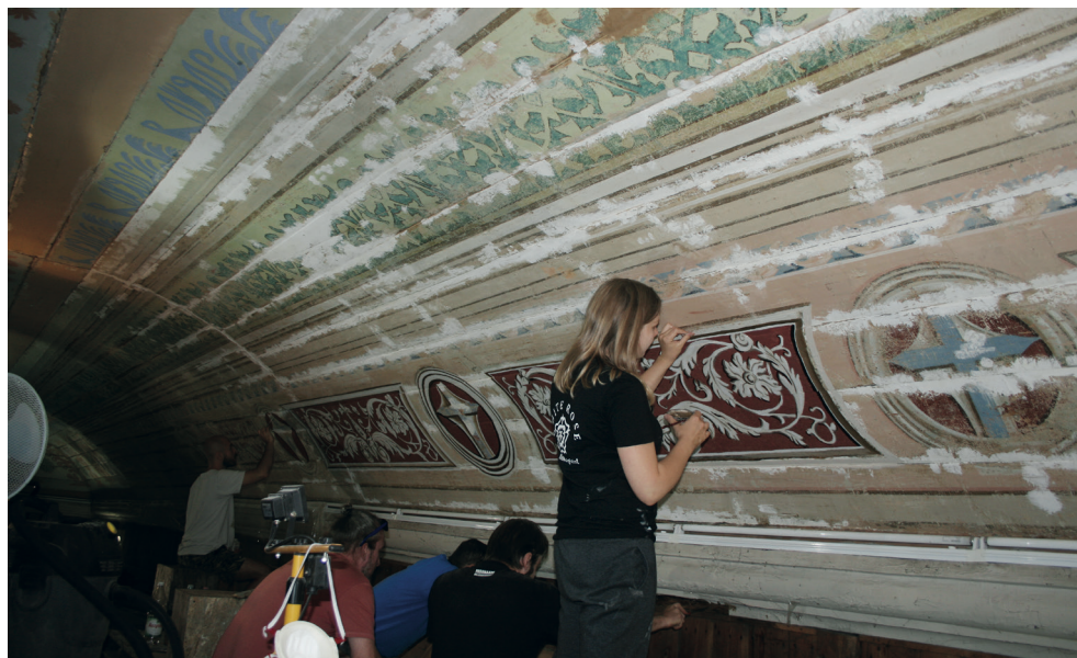
11. Turośl. Kościół pw. św. Jana Chrzciciela. Prace konserwatorskie przy polichromii stropu, 2018.