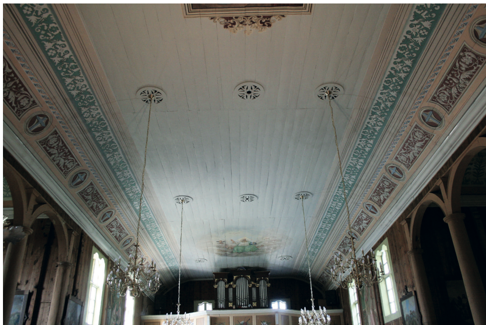
14. Turośl. Kościół pw. św. Jana Chrzciciela. Polichromia po konserwacji, 2018. Turośl. Church of St. John the Baptist. Polychrome after conservation, 2018.

ką Nowinę, trzymający w dłoni złote berło, stojący w długiej szacie przed klęczącą Marią, odzianą w czerwoną suknię i błękitny płaszcz. Na podstawie klęcznika leży biała lilia. Nad całością obrazu unosi się gołębica – Duch Święty. Fasety dekorowane są układem ornamentów – głównym motywem są ujęte w ramy architektoniczne, mięsiste akanty na czerwonym tle i krzyże na tle błękitnym. Powyżej znajduje się pas ornamentu falistego w tonacji błękitów i różów, a nad nim okuciowy ornament w tonacji zieleni. Całości tej partii dopełnia układ pasów w tonacji bieli i brązów. Gzyms koronujący pozostał w kolorze bieli lekko złamanej umbrą. Pozostawiono jako świadka nienaruszony fragment stropu za ołtarzem głównym, gdzie znajdują się również inskrypcje mówiące o historii kościoła oraz kolejnych wykonawcach prac malarskich i konserwatorskich.