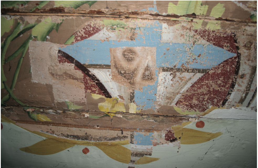
5. Turośl. Kościół pw. św. Jana Chrzciciela. Prace konserwatorskie przy polichromii stropu, centralnie widoczna najstarsza polichromia z lat siedemdziesiątych XIX w., 2016. Turośl. Church of St. John the Baptist. Conservation of ceiling polychrome, in the centre: the oldest polychrome from the 1870s, 2016.

Prawdopodobnie ich skromny przekaz, a być może słaba technicznie jakość wykonania były powodem „odnowienia” w 1898 r., czyli po 26 latach od powstania