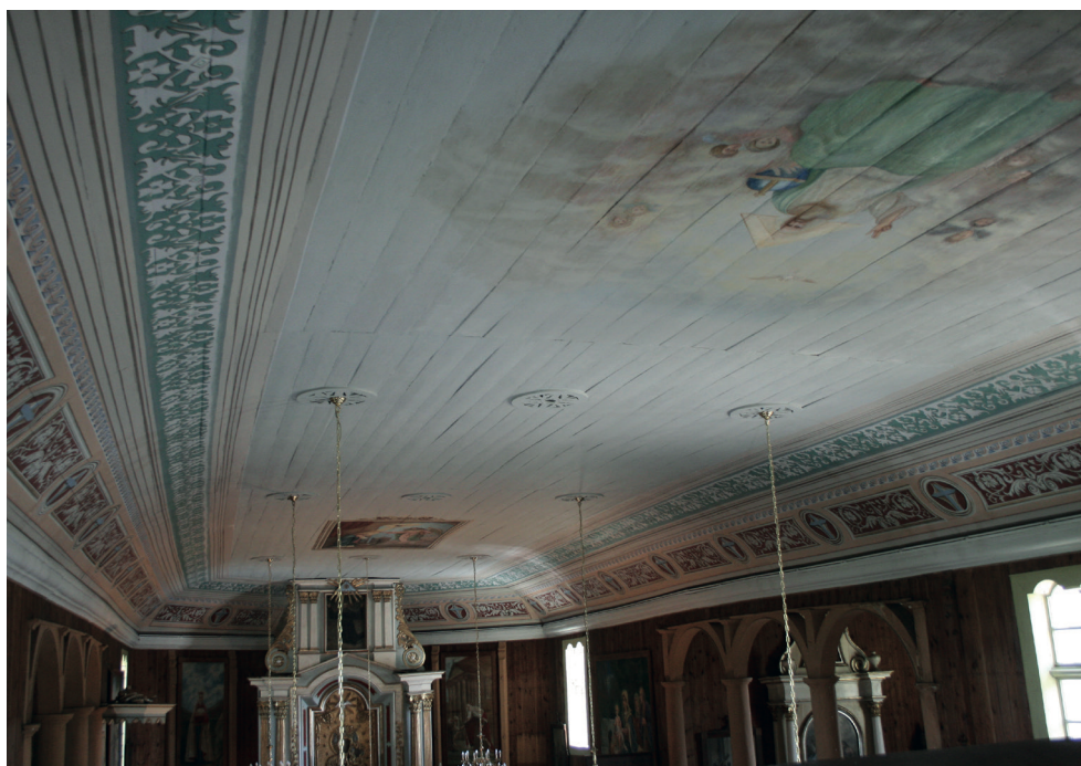
15, 16. Turośl. Kościół pw. św. Jana Chrzciciela. Polichromia po konserwacji, 2018. Turośl. Church of St. John the Baptist. Polychrome after conservation, 2018.