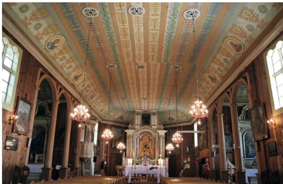
2. Turośl. Kościół pw. św. Jana Chrzciciela. Wnętrze, 2014. Turośl. Church of St. John the Baptist. Interior, 2014.

Obecnie w kościele są trzy ołtarze. W głównym znajduje się obraz Matki Bożej Częstochowskiej zaślaniany obrazem Pana Jezusa na krzyżu, w zwieńczeniu jest obraz Mojżesza. Po bokach ołtarza stały małe figury św. Antoniego i św. Teresy (niestety zostały skradzione). W kaplicy po lewej stronie umieszczono obraz św. Antoniego i nad nim obraz św. Judy Tadeusza. W drugiej kaplicy są obrazy św. Jana Chrzciciela i u góry św. Józefa. Ponadto w kaplicy pod wieżą znajduje się obraz św. Maksymiliana Kolbego 2 .