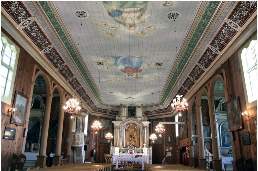
10. Wizualizacja polichromii stropu, 2014. Autor: K. Michałowski Visualisation of ceiling polychrome, 2014. K. Michałowski

Projekt zakładał, że wtórne warstwy przemalowań zostaną usunięte do warstwy pierwotnej w partii centralnej stropu, gdzie występuje przedstawienie, zaś w partiach faset wstępne założenie zakładało usunięcie przemalowań do warstwy z 1898 r., o wartościowych walorach artystycznych, i po wykonaniu pełnego odsłonięcia tej warstwy chronologicznej i uzyskaniu dokładniejszego rozpoznania najstarszej warstwy podjęcie ostatecznych decyzji co do zakresu i stopnia odsłaniania dwóch najstarszych warstw polichromii.