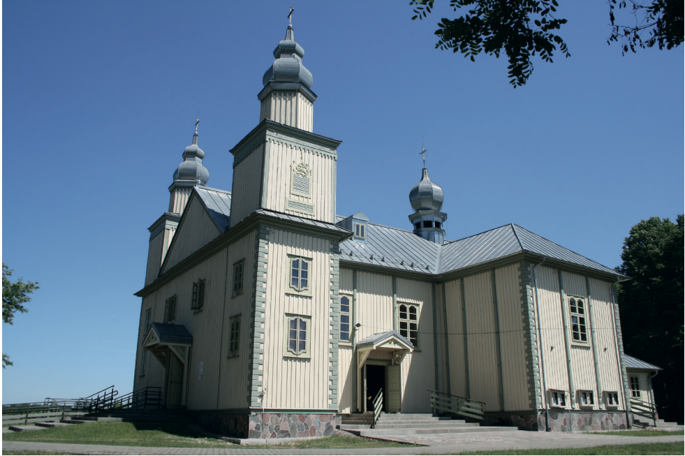
1. Turośl. Kościół pw. św. Jana Chrzciciela, 2016. Turośl. Church of St. John the Baptist, 2016.

pochodzi z 1930 r (trzecia warstwa chronologiczna). W okresie powojennym powstały dwie kolejne warstwy chronologiczne, ostatnia w 1981 r.