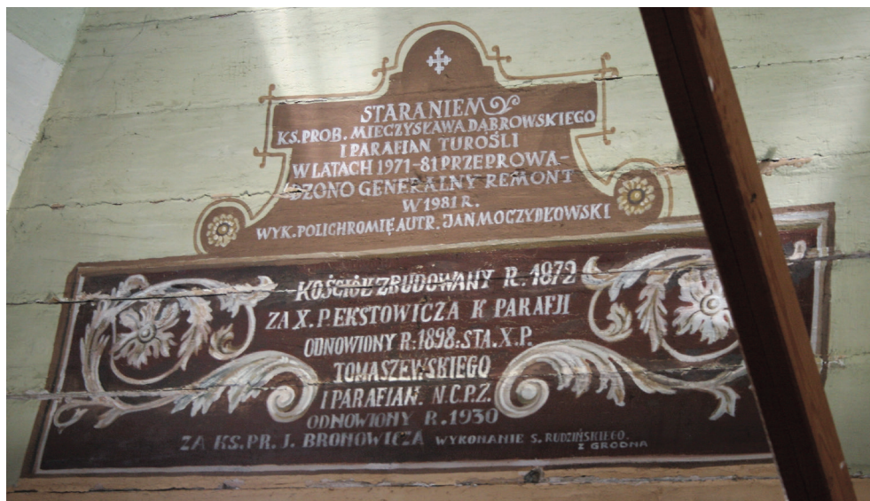
7. Turośl. Kościół pw. św. Jana Chrzciciela. Inskrypcja za ołtarzem głównym, 2014. Turośl. Church of St. John the Baptist. Inscription behind the main altar, 2014.

motywy okuciowe obrysowane ciemnym, brązowym paskiem na jasnym, kremowo-żółtym tle. Powyżej znajduje się szeroki ornament paskowy w kolorach beżu, brązu i bieli.