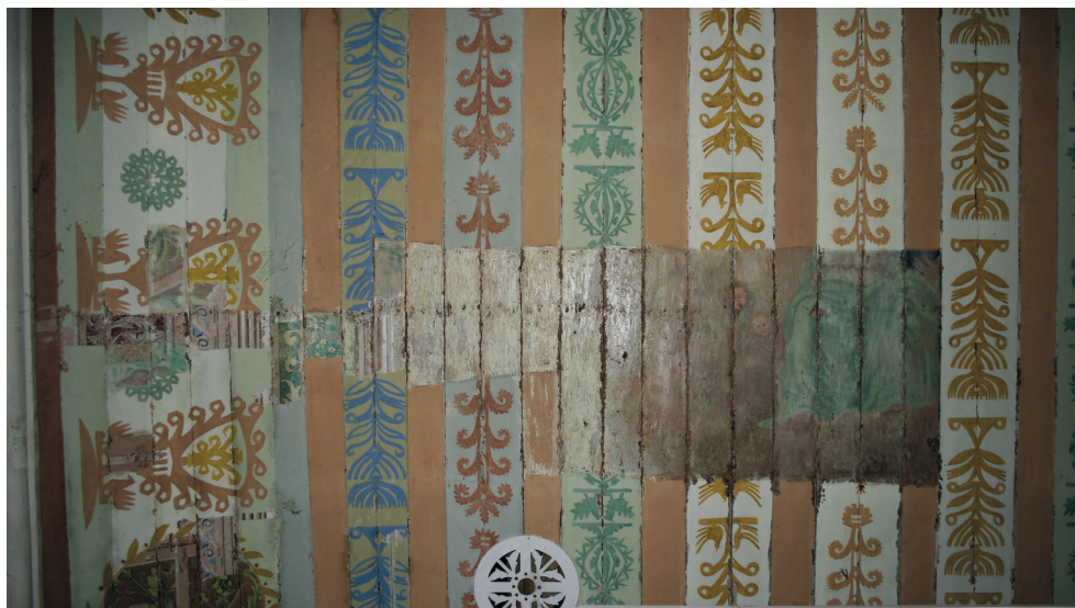
4. Turośl. Kościół pw. św. Jana Chrzciciela. Odkrywka na stropie nawy, 2015. Turośl. Church of St. John the Baptist. Findings on the nave ceiling, 2015.