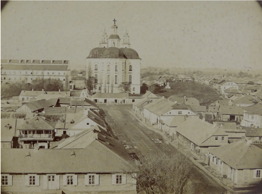
Il. 3. Kościół i klasztor Jezuitów od wschodu. Fot. 3–4 ćw. XIX w.

ważnym ośrodkiem pielgrzymkowym, a towarzyszył jej budowany przez niemal sto lat, nigdy nie ukończony, imponujący gmach kolegium 15 (il. 3).