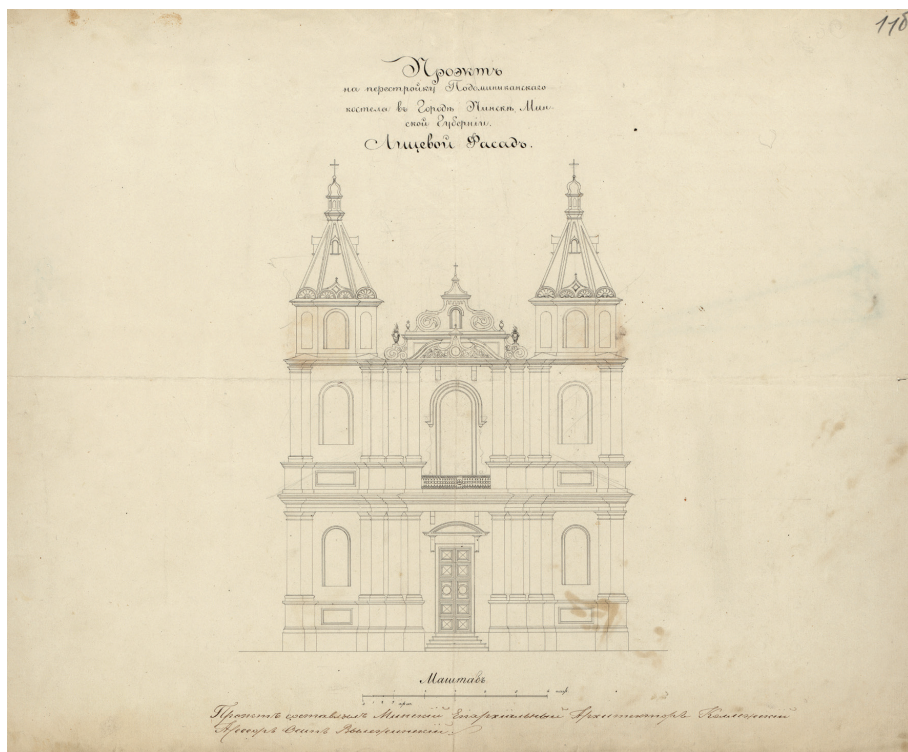
Il. 5. Kościół Dominikanów, fasada. Projekt przebudowy na cerkiew, 1860.

W 1845 roku piński klasztor dominikanów skasowano, a pięć lat później wraz z kościołem został przekazany duchowieństwu prawosławnemu. W 1860 roku powstały co najmniej dwa projekty przebudowy kościoła na cerkiew – jeden z nich, zrealizowany do 1864 roku, obejmował wzmocnienie murów fasady i dostawienie nad nią dwukondygnacyjnej wieży oraz prawie równej jej wysokości sygnaturki ponad drugim przęsłem. Alternatywną propozycją był publikowany tu po raz pierwszy projekt 19 proponujący rozbudowanie fasady o dwie trójkondygnacyjne wieże wzniesione w jej osiach bocznych, z ośmiobocznymi hełmami zdobionymi kokosznikami. Na osi zwieńczenia został rozrysowany zdwojony, pseudobarokowy szczyt o wolutowych spływach (il. 5). Elewacje boczne miały pozostać, jak się wydaje, bez większych ingerencji (il. 6), podobnie jak mury świątyni widoczne na