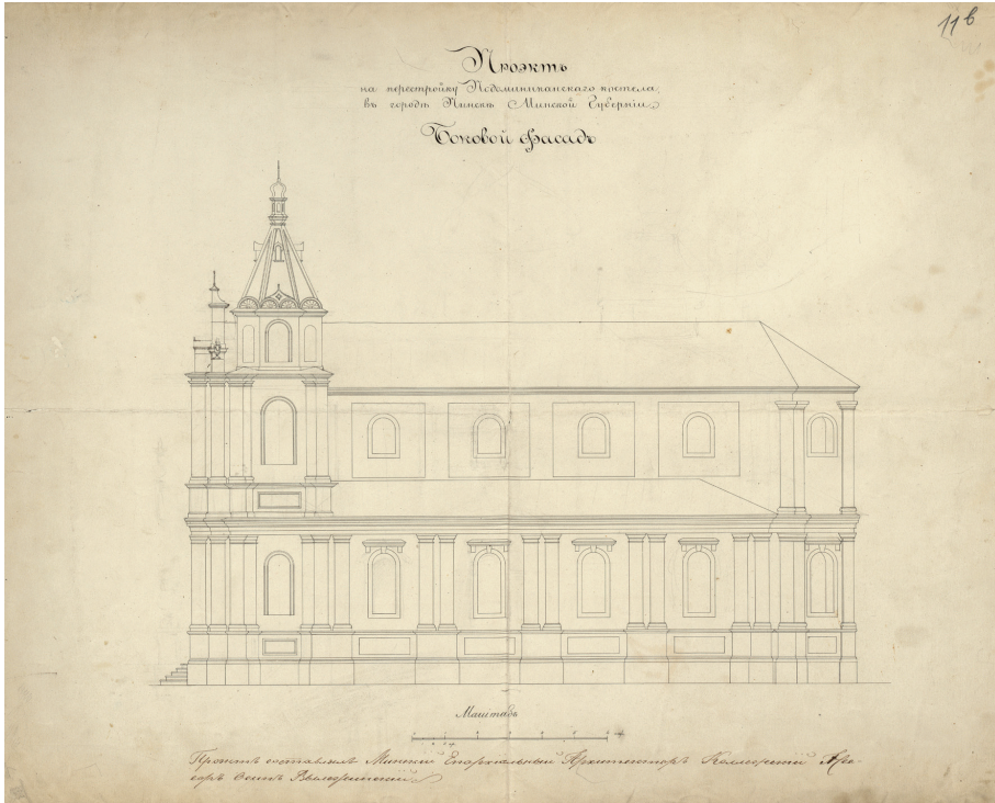
Il. 6. Kościół Dominikanów, elewacja boczna. Projekt przebudowy na cerkiew, 1860.

rysunku jej rzutu, gdzie jedynie dodano ścianki w obrębie przęśla chórowego, zamknięto otwory od strony prezbiterium i wrysowano ikonostas (il. 7). Nie dziwi fakt, że do realizacji wybrano projekt z jedną wieżą w fasadzie – z pewnością według wiernych bardziej wpisywał się w stylistykę architektury cerkiewnej, dwie wieże zaś kojarzone były raczej z budynkiem kościoła katolickiego lub unickiego.