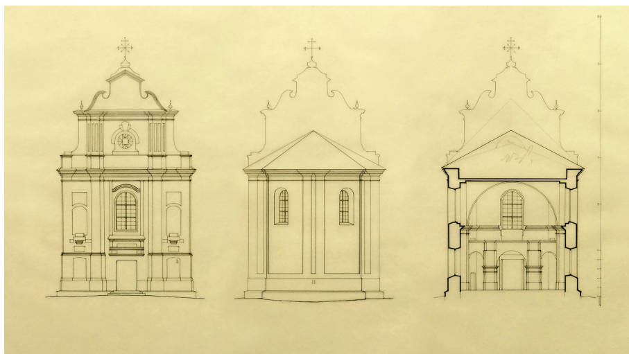
Il. 2. Kościół Bernardynów. Pomiary fasady, prezbiterium i przekrój poprzeczny, 1926. Wydział Architektury Polskiej Politechniki Warszawskiej, sygn. 12804/III.

wnętrze i tworząca pięć iluzjonistycznych ołtarzy. Przez monografistę obiektu została przypisana Kazimierzowi Antoszewskiemu, mińskiemu freskantowi działającemu w ostatnim dwudziestolecu XVIII wieku na terenie Wielkiego Księstwa Litewskiego 12 . Jak pisze Zbigniew Michalczyk: „Charakterystyczną cechą stylu Antoszewskiego było niemal perfekcyjne opanowanie techniki malarstwa iluzjonistycznego przy słabszym wykonaniu partii figuralnych, a także łączenie motywów wczesnoklasycystycznych (zależnych zapewne przede wszystkim od francuskiej grafiki ornamentальной 3. ćw. XVIII w.) z rozwiązaniami późnobarokowymi, wzorowanymi m.in. na rytowanych powtórzeniach projektów Andrei Pozza czy Paula Deckera” 13 .