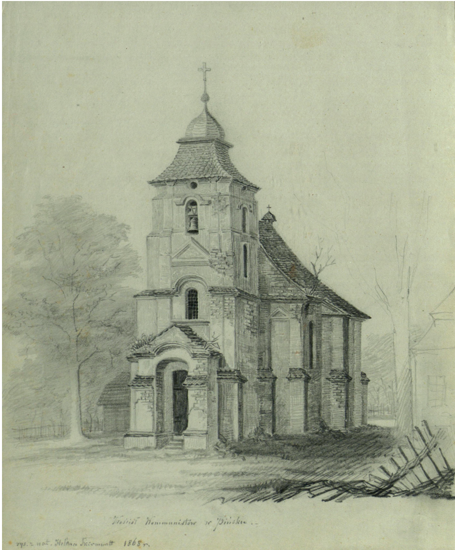
Il. 1. Kościół Komunistów. Rysunek Heleny Skirmuntt, 1868. Lietuvos Mokslų Akademijos Biblioteka, Wilno, sygn. 320-927.

wówczas w kościele ulokowano cerkiew, a klasztor przekazano prawosławnym mniszkom. W latach sześćdziesiątych XIX wieku na dachu świątyni zainstalowano ośmioboczny tambur z baniastą kopułą, który do dzisiaj wyraźnie podkreśla jej cerkiewny charakter. Niewątpliwie najważniejszy i najciekawszy artystycznie element pierwotnego wystroju bernardyńskiej świątyni stanowiła barokowo-klasycystyczna polichromia, pokrywająca całe