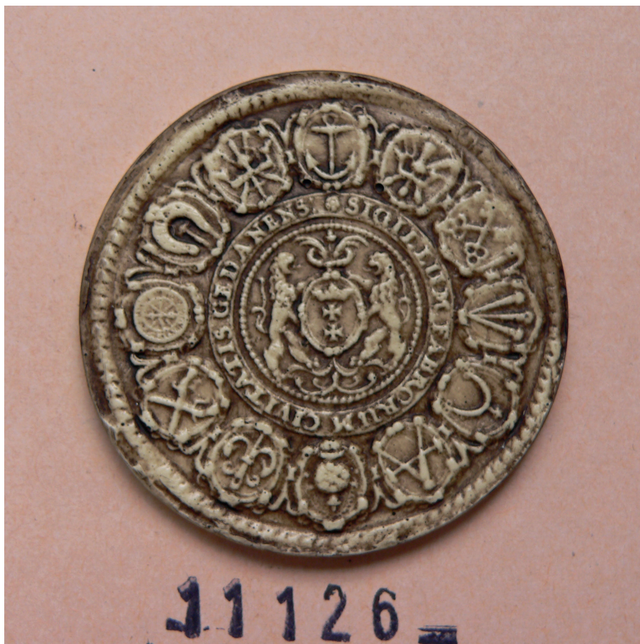
Il. 4. Gdańska pieczęć cechowa, Gdańsk, XVII w., Archives Nationales de France, Paryż, Sekcja Sfragistyczna, nr 11126.

Pod sygnaturą J 952 nr 9 znajdujemy dokument pochodzący ze stycznia 1519 r., dotyczący kandydatury króla Francji Franciszka I w elekcji cesarskiej. Dokument zawiera instrukcje królewskie przekazane jego wysłannikom, Janowi de Langeac 6 i Antoniemu de Lamet 7 , którzy zostali wysłani na dwór króla Polski. Mieli oni uzyskać poparcie Zygmunta I Starego dla francuskiej kandydatury na tron cesarski.