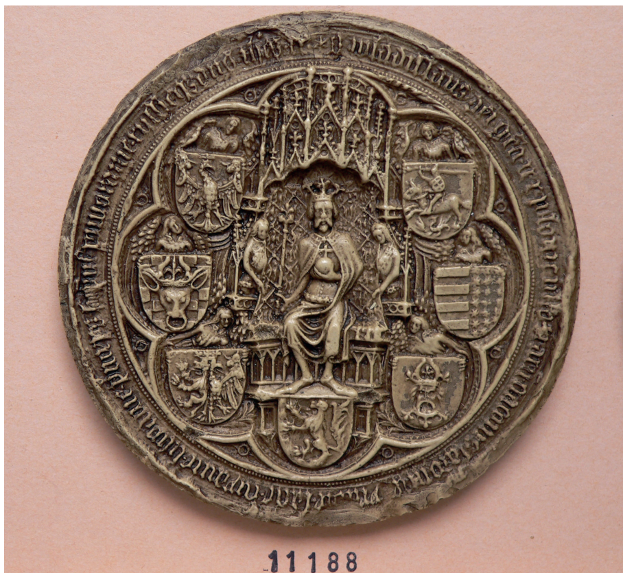
Il. 8. Pieczęć majestatyczna króla Polski Władysława IV Wazy, Archives Nationales de France, Paryż, Sekcja Sfragistyczna, nr 11188.

1632 r. Dokumenty te są kopiami. Z kolei pod sygnaturą K 1308 nr 51-54 znajdujemy trzy traktaty dotyczące spraw polsko-moskiewskich, z czego jeden pochodzi z roku 1690 (nr 53), a dwa pozostałe z wieku XVIII (1720, 1768).