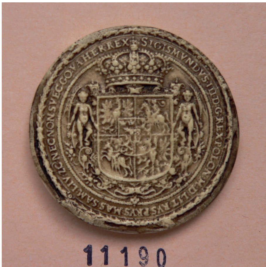
Il. 2. Pieczęć majestaticzna króla Polski Zygmunta III Wazy, Archives Nationales de France, Paryż, Sekcja Sfragistyczna, nr 11190. Fot. K. Polejowski.

królem Karolem V a królem Węgier i Polski Ludwikiem Andegaweńskim – miał on dotyczyć małżeństwa syna króla Francji Ludwika Orleańskiego z córką króla Ludwika Katarzyną lub inną z dwóch jego córek 4 . Dokument nr 3 jest opatrzony pieczęcią króla Ludwika i został wystawiony w Budzie 24 grudnia 1374 r. Dokumenty spoczywające pod tą sygnaturą zostały wystawione między 16 kwietnia 1374 r. a grudniem 1375 r.