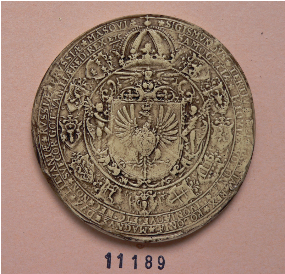
Il. 1. Pieczęć majestatyczna króla Polski Zygmunta III Wazy, Archives Nationales de France, Paryż, Sekcja Sfragistyczna, nr 11189.

swoją pomoc przeciwko wspólnym wrogom, poza cesarzem. Dokument został opieczętowany, a wystawiono go w Fontainebleau, w styczniu 1332 r.