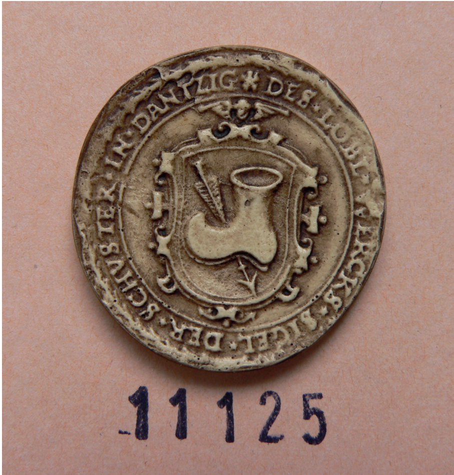
Il. 3. Pieczęć cechu szewców, Gdańsk, XVII w., Archives Nationales de France, Paryż, Sekcja Sfragistyczna, nr 11125.

łończykiem i Janem Olbrachtem. Dokument opieczętowany pieczęciami królewskimi, wstawiony w Budzie 14 lipca 1500 r. (por. dok. J 432, nr 26).