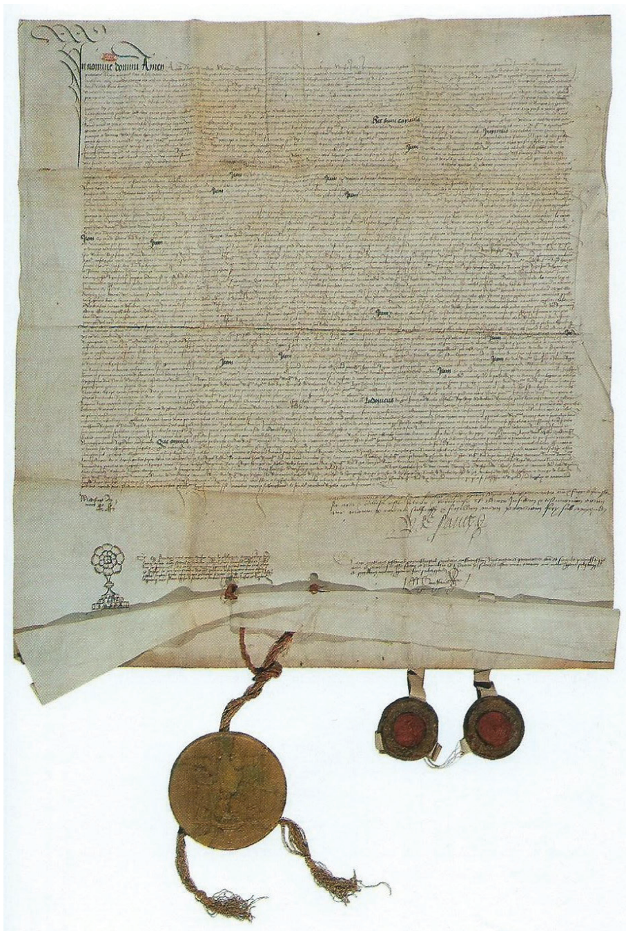
Il. 8. Traktat sojuszniczy zawarty między królem Francji Ludwikiem XII, królem Polski Janem Olbrachtem i królem Węgier, Władysławem Jagiellończykiem. Buda, 14 lipca 1500, Archives Nationales de France, Paryż, J 458, Hongrie, nr 11.