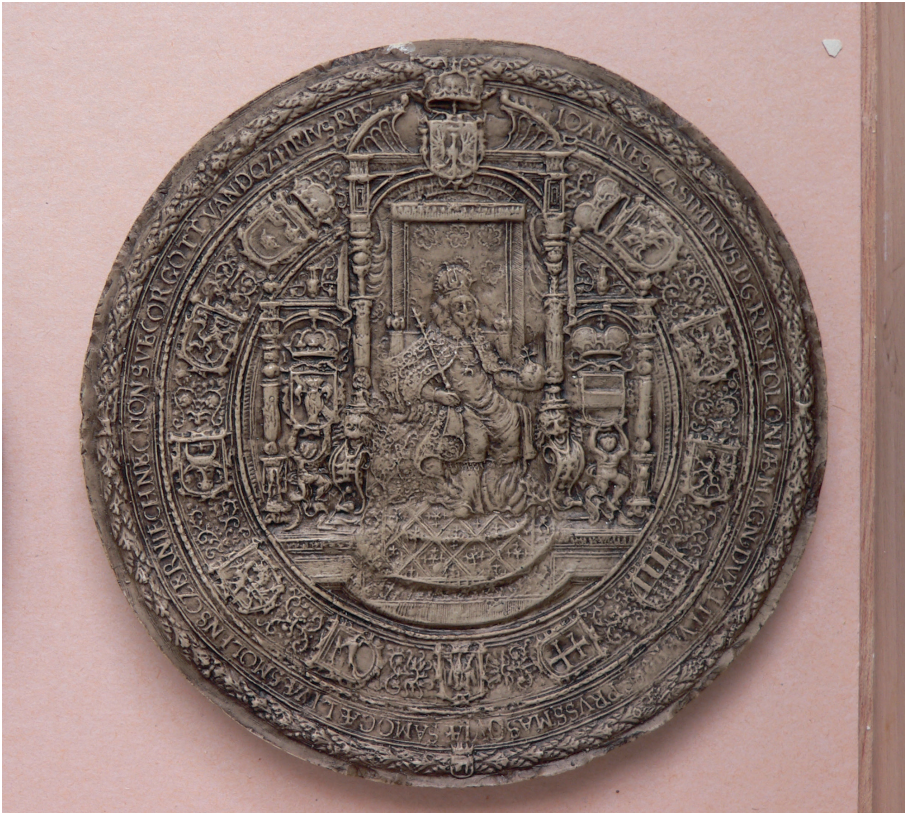
Il. 6. Pieczęć majestaticzna króla Polski Jana II Kazimierza Wazy, Archives Nationales de France, Paryż, Sekcja Sfragistyczna, nr 11193.

Seria K 541 nr 29–47 oraz K 566 nr 1–6 i 8–10 dotyczy głównie sprawy małżeństwa (1663) księcia Henryka Juliusza de Bourbon, diuka Enghien, z Anną Bawarską, siostrzenicą Ludwika Marii Gonzagi. Z tą parą książęcą wiąże się też zawartość kartonu K 542 nr 60 i 60 bis dotycząca kwestii finansowych księstwa opolskiego i raciborskiego, szczególnie po śmierci Karola Ferdynanda Wazy (zm. 1655). Są to kopie dokumentów noszące datę 18 maja 1685 r.