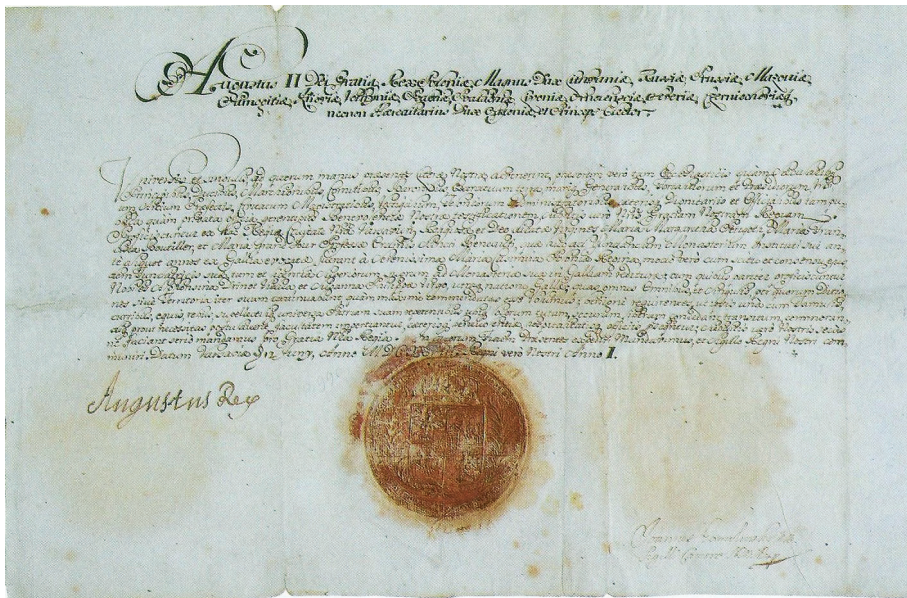
Il. 5. List żelazny króla Augusta II Mocnego wystawiony dla podróżujących z Warszawy do Paryża trzech zakonnic, Warszawa, 12 czerwca 1698, Archives Nationales de France, Paryż, L 1075, nr 1.

Pod sygnaturą J 964 znajdują się dokumenty kanclerza Wilhelma Poyet 8 i jego poprzedników, a dokument nr 20 to list skierowany do admirała Francji Wilhelma de Bonnivet 9 przez Antoniego Rincon 10 zawierający sprawozdanie z podróży dyplomatycznej do królestwa Węgier, na Wołoszczyznę i do Polski. Dokument w języku włoskim, sporządzony w Wenecji 4 kwietnia 1523 r.