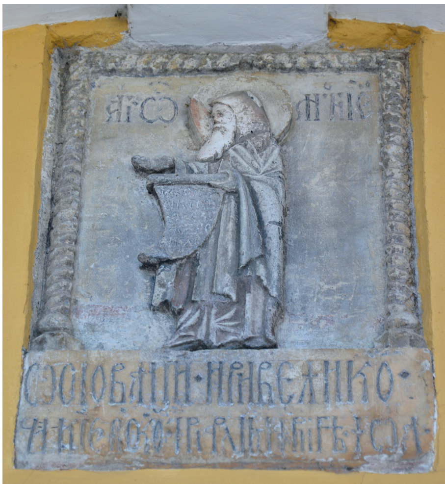
Il. 10. Tablica z postacią św. Antoniego Peczerskiego adorującego postać Matki Boskiej.