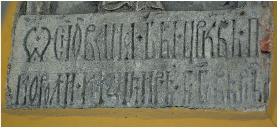
Il. 6. Inskrypcja z tablicy z przedstawieniem św. Teodozjusza Peczerskiego.

nymi rękoma) w centrum oraz postacią św. Antoniego i św. Teodozjusza Peczerskich po bokach. Postaci świętych prawymi dłońmi wskazują na Matkę Boską, adorując ją. Właściwy układ kompozycji stawia św. Antoniego po prawej stronie, a św. Teodozjusza po lewej stronie tryptyku (dziś są zamienione). Układ prawidłowy, wynikający z treści i kompozycji, został unieczystniony. Przynajmniej doszło do tego wskutek działania zamierzo-