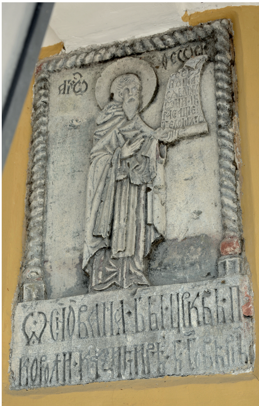
Il. 7. Tablica z postacią św. Teodozjusza Peczerskiego.