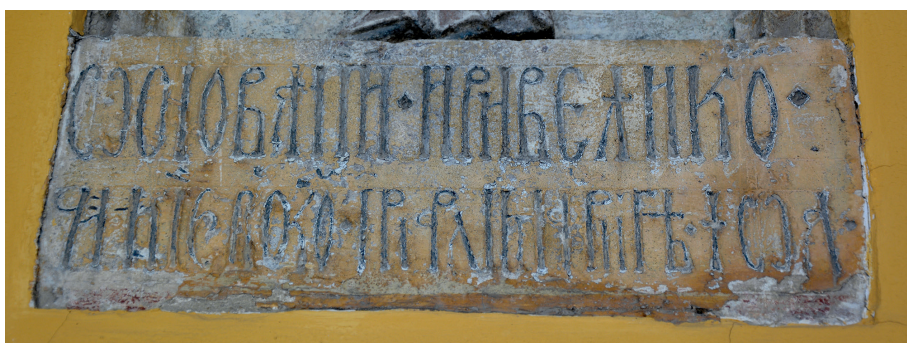
Il. 11. Inskrypcja z tablicy z przedstawieniem św. Antoniego Peczerskiego.