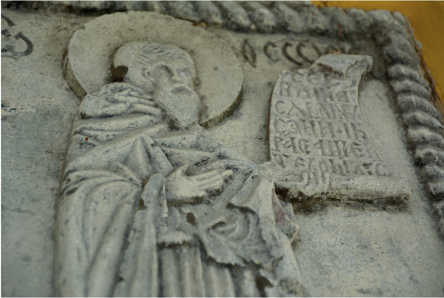
Il. 5. Fragment tablicy z postacią św. Teodozjusza Peczerskiego.