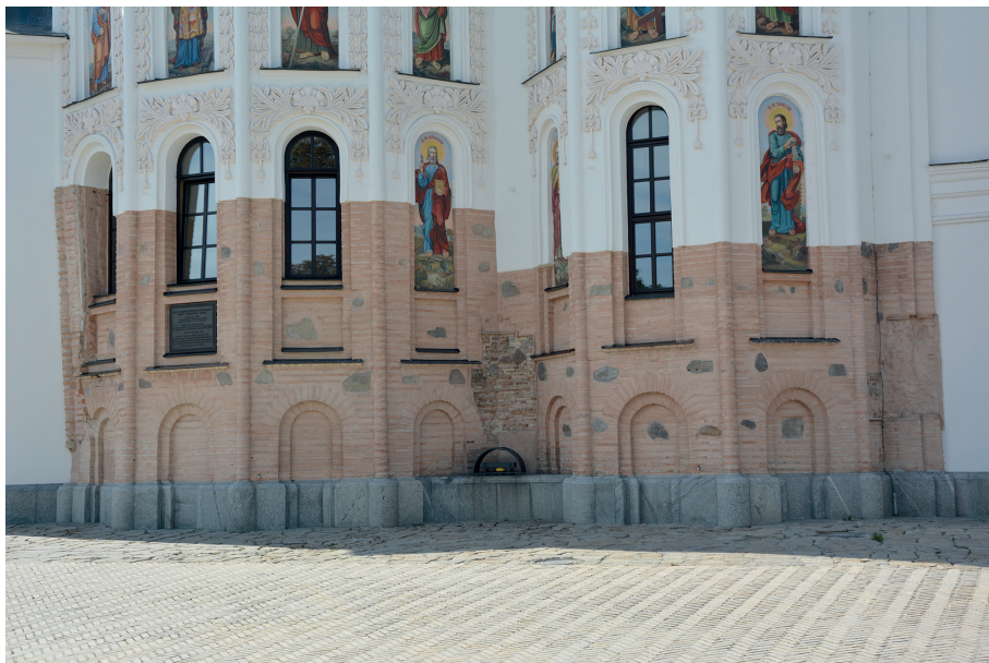
Il. 2. Według przekazów historycznych tryptyk pierwotnie znajdował się na centralnej absydzie elewacji soboru Uspieńskiego.