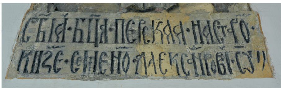
Il. 9. Inskrypcja z tablicy z przedstawieniem Matki Boskiej.