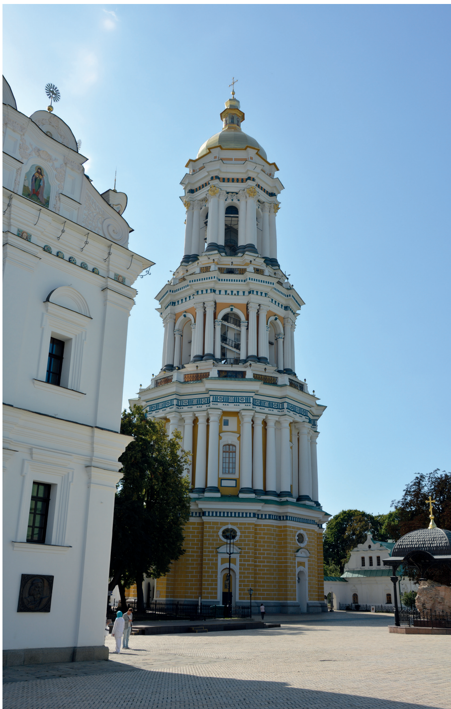
Il. 4. Wielka Dzwonnica Ławry Peczerskiej w Kijowie.