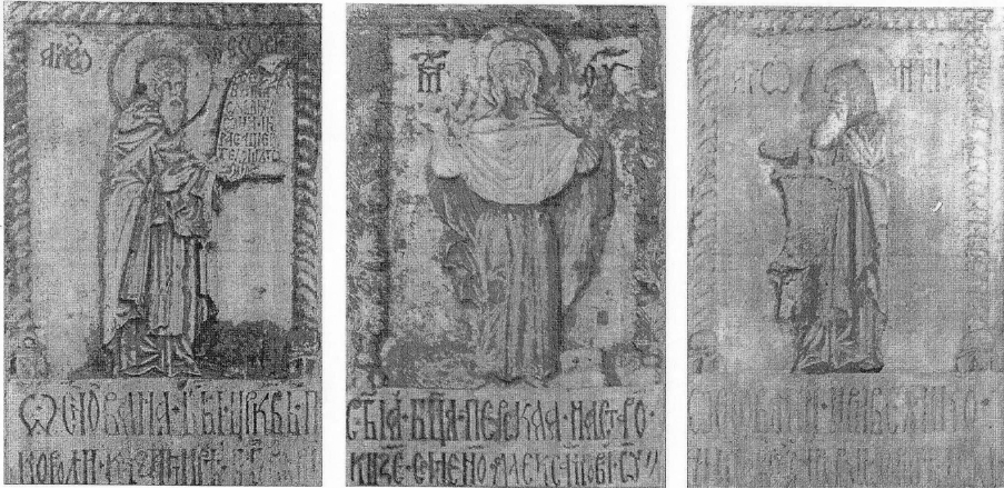
Il. 1. Widok prawidłowego schematu kompozycyjnego tryptyku z Wielkiej Dzwonnicy Ławry Peczerskiej w Kijowie.

czony w 1470 r., na pamiątkę odbudowy soboru ufundowanej przez Semenę Aleksandrowicza Oelkowicza (Szymona, Siemiona; Симеон Александрович Оелькович) 1 . Do tego wydarzenia nawiązuje inskrypcja w języku staro-cerkiewno-słowiańskim łącząca trzy płaskorzeźby, mówiąca o tym, że cerkiew została założona na starych fundamentach za Wielkiego Króla Kazimierza przez pobożnego Semenę Aleksandrowicza, księcia kijowskiego, za panowania archimandryty Joana (Іанне).