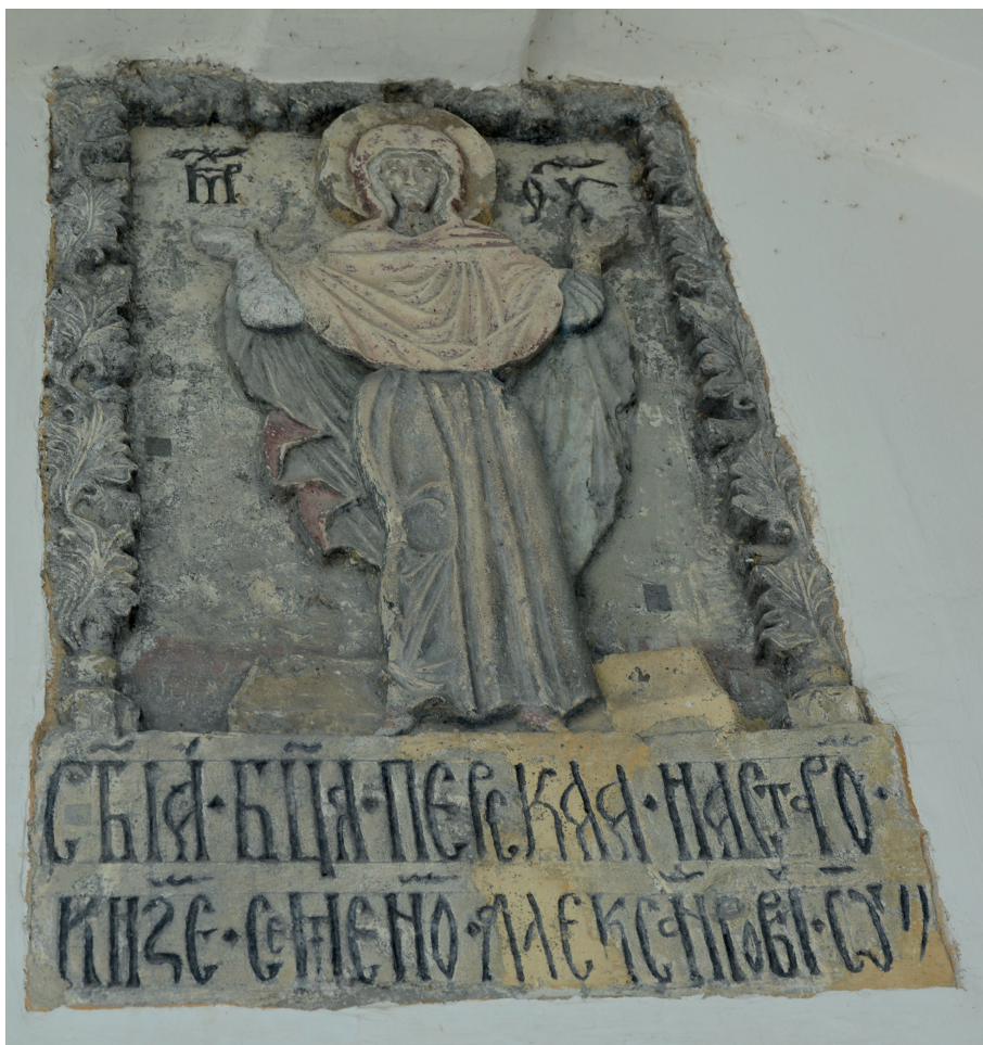
Il. 8. Centralna tablica z przedstawieniem Matki Boskiej w pozie orantki.