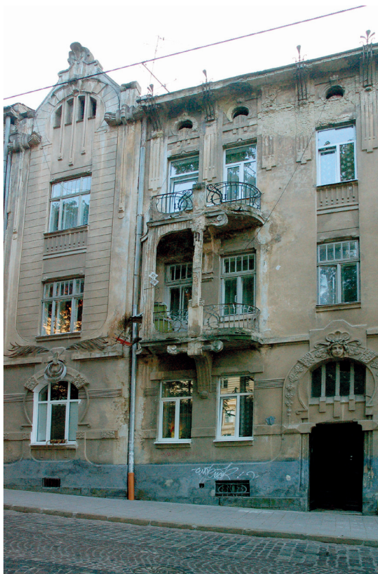
П. 14. Типова еklekтычна камініца Львоўскай Школы Архітэктурна-лічнай з сесэсійнымі элементамі, ул. Івана Франка 124 (укр. Івана Франка). А. Відок агульны; В. Фрагмент елевасцы.