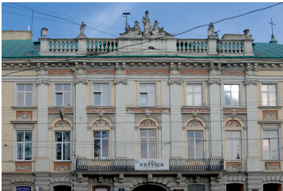
П. 3. Klasycystyczna kamienica, róg ul. Czarnieckiego (ob. ul. W. Winniczenka 8, ukr. Володимира Винниченка) i Łyczakowskiej (ukr. Личаківська), 1804–1805 proj. Hartmann i Johann Michael Witwer, nadbudowa 1839 Franciszek Tomek. A. Widok ogólny; B. Środkowa część elewacji.