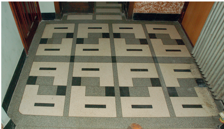
Il. 40. Typowe elementy budynków Lwowskiej Szkoły Architektonicznej – kolorowe lastryka we wnętrzach – kamienica przy ulicy Dąbrowskiego 7 (ob. Rutkowicza, ukr. Івана Рутковича), fragment wielobarwnego lastryka klatki schodowej.

i artystycznym Lwowa zawierają też wspomnienia M. Tyrowicza, W. Szolginii i innych 95 .