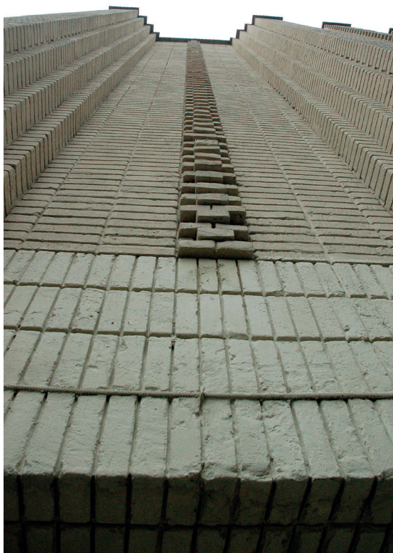
Il. 45. Nietypowy budynek w duchu Warszawskiej Szkoły Architektonicznej wzniesiony we Lwowie – Dom Związku Pracowników Kolejowych (ob. Палац культури залізничників), ul. Fedkowicza 54–56 (ukr. Федьковича), 1938, proj. Romuld Müller (z Warszawy) dla Związku Kolejarzy, budowa Henryk Zarembo. A. Widok ogólny; B. Fragment elewacji.