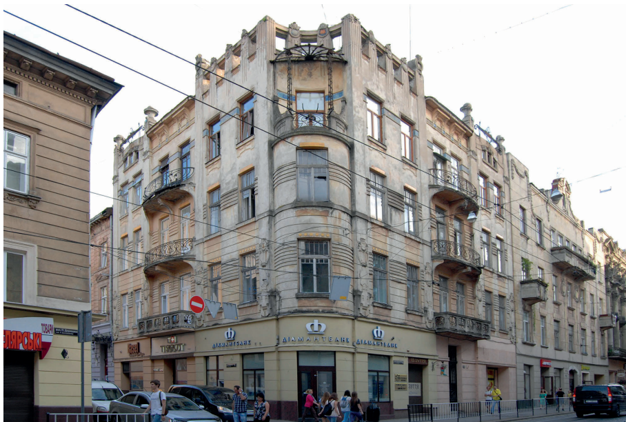
Il. 10. Jedna z pierwszych secesyjnych kamienic Lwowskiej Szkoły Architektonicznej – kamienica Josefa Hausmanna, róg ul. Sykstuskiej 15 (ob. P. Doroszenki, ukr. Петра Дорошенка) i Szajnochy (ob. Bankiwska, ukr. Банківська), 1906–1907, proj. Zygmunt Kędziński i Michał Ułam, widok ogólny.

ła ona w latach 1939–1940, kończona była do 1945 r., a drukiem ukazała się dopiero w 1974 r. w Londynie 19 . Opublikowana książka zawiera prezentację lwowskiej sztuki jedynie do końca XVIII w., gdyż tekst przygotowanej pracy skrócono, aby w ogóle mogła się ukazać. Wydawcy uznali, że okres, w którym miasto było stolicą zaboru austriackiego, nie wydał tak ważnych pomników architektury i sztuk plastycznych jak okresy poprzednie, dlatego fragment pracy dotyczący wieku XIX pozostał w rękopisie i nadal spoczywa w Archiwum Instytutu Polskiego w Londynie. Praca ta – znana niewielu specjalistom – zapoczątkowała szersze badania nad XIX-wieczną architekturą lwowską.