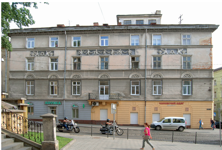
Pl. 4. Klasycystyczne kamienice Lwowskiej Szkoły Architektonicznej. A. ul. Batorego 24 (ob. Kniazia Romana, ukr. Князя Романа), 1829–1830, proj. Fryderyk Baumann lub Ignacy Chambrez, dekoracja rzeźbiarska Jan Schimser 1830; B. róg ul. Kościelnej (ob. Iwana Gonti 34, ukr. Івана Гонти) i Krakowskiej 34 (ukr. Краківська), pocz. XIX w.