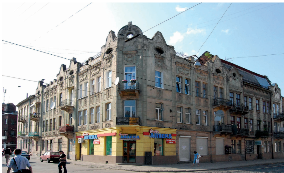
Il. 12. Typowa secesyjna kamienica Lwowskiej Szkoły Architektonicznej, kamienica rog ul. Zamarstynowska 11 (ukr. Замарстинівська 11 і вул Долинська 8).

tomy prezentują szeroko różne zagadnienia dziejów Lwowa i są zarówno zbiorami studiów, jak i opracowaniami monograficznymi. W kilku woluminach zwrócono uwagę na rozwój miasta i jego przemiany oraz powstające tam budowle 28 . Podano tam wiele źródłowych informacji na temat rozbudowy miasta i zaprezentowano aktualny stan wiedzy historycznej na ten temat.