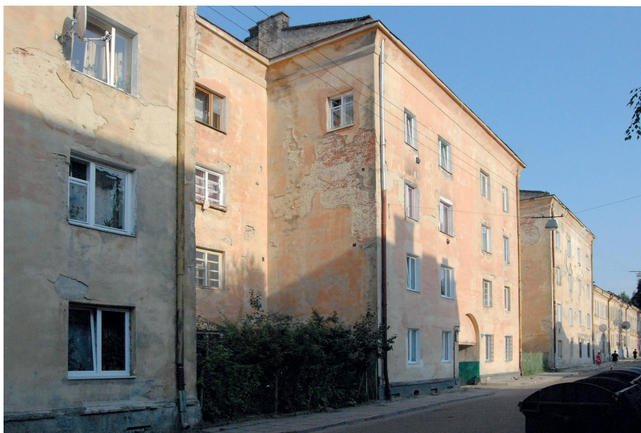
Il. 24. Przykład taniego budownictwa miejskiego Lwowskiej Szkoły Architektonicznej – zespół budynków przy ul. Arciszewskiego 8 (ob. O. Grekova, ukr. Генерала Грекова), 1928–31, proj. Zbigniew Rzepecki.