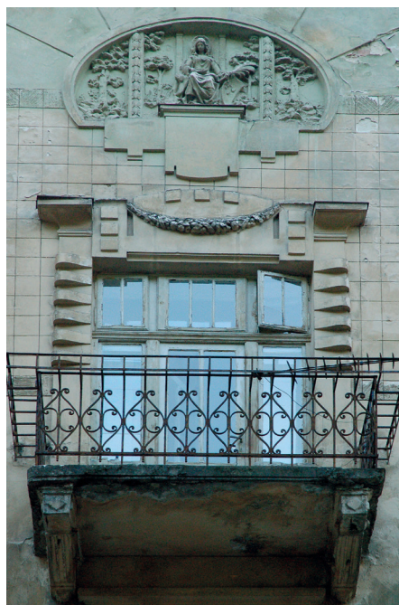
Il. 13. Typowe eklektyczne kamienice Lwowskiej Szkoły Architektonicznej z secesyjnymi elementami, ul. Iwana Franki 130 (ukr. Івана Франка). A. widok ogólny; B. Fragment górnej części elewacji.

wiają nurty i tendencje w rozwoju architektury Lwowa przełomu wieków; krótko zaprezentowano sylwetki ważniejszych twórców tego czasu.