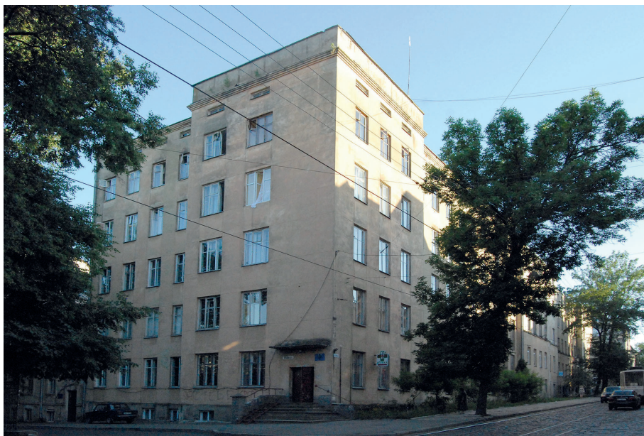
Il. 46. Przykłady budynków szkolnych Lwowskiej Szkoły Architektonicznej. A. Prywatne Gimnazjum Żeńskiego ss. Urszulanek, 1931–34, proj. Tadeusza Wróbla i Leopolda Karasińskiego; B. XIII Państwowe Gimnazjum Żeńskie im. Królowej Jadwigi, ul. Potockiego 35 (ob. Gen. Czupryni 43, ukr. Генерала Чупринки), 1930–1932, bud. kier. Marian Nikodemowicz.