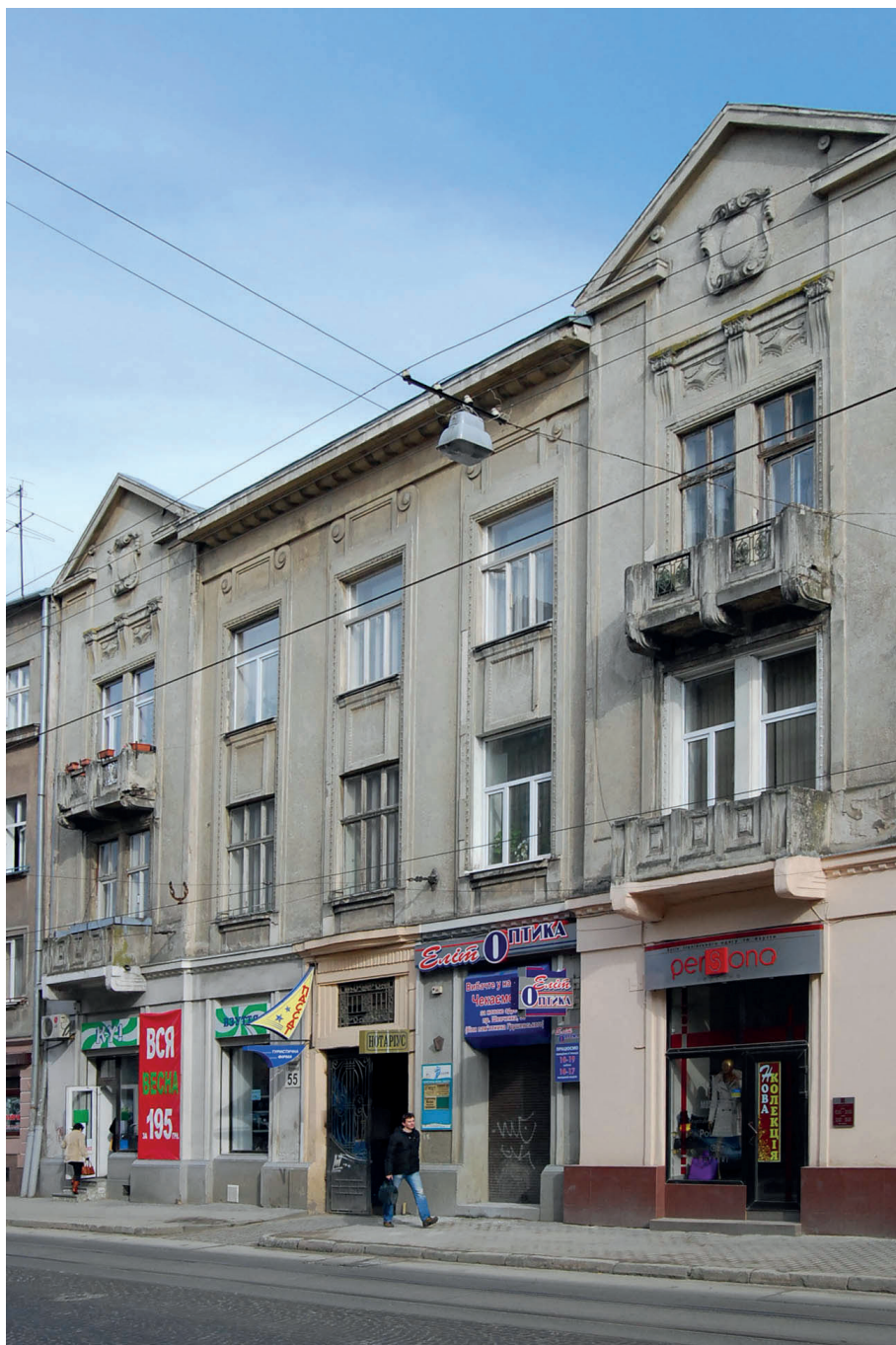
Il. 17. Eklektyczna kamienica z biura Michała Ulama – jednego z większych biur architektonicznych działających przed 1914 rokiem – ul. Iwana Franki 55 (ukr. Івана Франка).