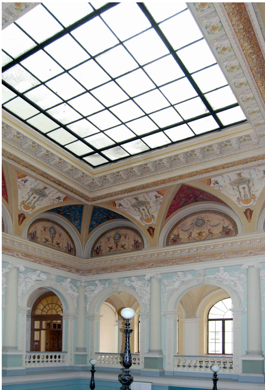
Il. 1. Hol wejściowy gmachu głównego Politechniki Lwowskiej, miejsca kształcenia architektów Lwowskiej Szkoły Architektonicznej, ul. Leona Sapiehy 12, (ob. S. Bandery, ukr. Степана Бандери), proj. Julian Zachariewicz, klatka schodowa, rzeźby Leonard Marconi, dekoracja Maurycy i Eisiß Fleckowie, Emil Schrödl.