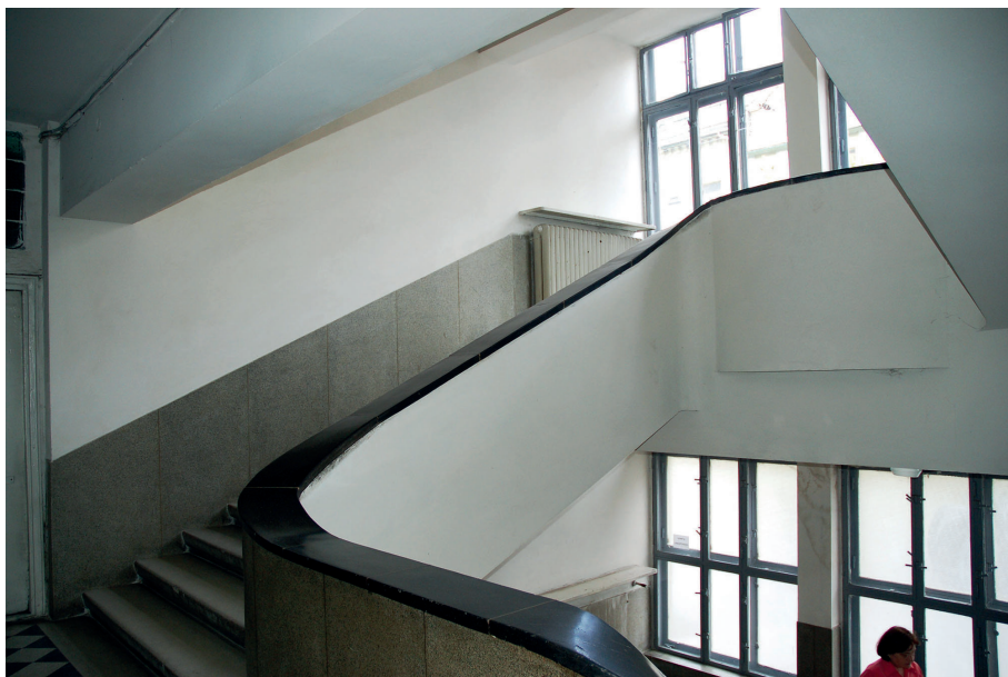
Il. 42. Budynek użyteczności publicznej Lwowskiej Szkoły Architektonicznej – Zakład Ubezpieczeń Społecznych, ul. Zielona 12 (ukr. Зелена), 1937–39, proj. Jan Bagiński w biurze architektonicznym Dembińskiego. A. Widok ogólny; B. Klatka schodowa.