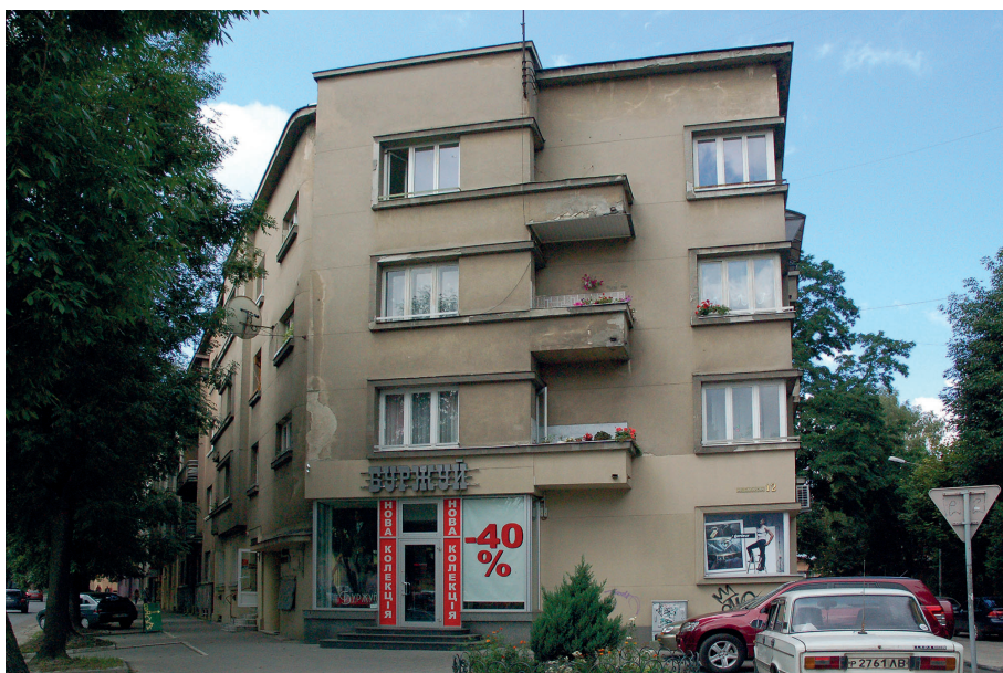
Il. 30. Przykłady funkcjonalistycznych kamienic Lwowskiej Szkoły Architektonicznej z połowy lat 30 XX wieku. A. Potockiego 16 (ob. Gen. Czuprynki, ukr. Генерала Чупринки); B. Wulecka 12 (ob. A. Sacharowa, ukr. Академіка Андрія Сахарова).