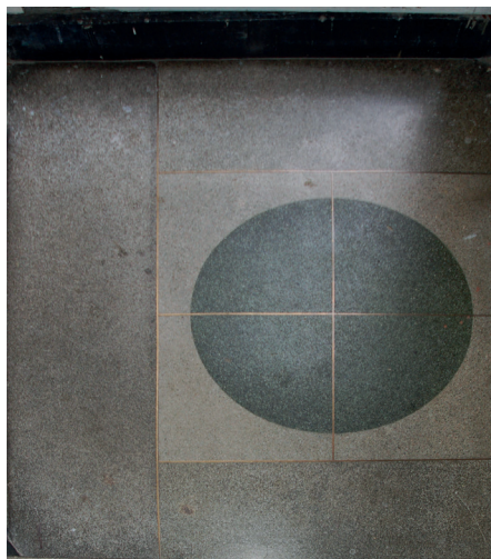
Il. 29. Typowa funkcjonalistyczna kamienica Lwowskiej Szkoły Architektonicznej – ul. Domagaliczow 6, (ob. Pawłowa, ukr. Академіка Павлова). A. Klatka schodowa, widok ogólny; B. Fragment lastryka klatki schodowej.

nowej. Problematykę architektury okresu międzywojennego Paweł Grankin poruszał również w kilku swoich artykułach 71 , a także na łamach lwowskiego czasopisma „Halicka Brama”, będącego w II połowie lat dziewięćdziesiątych XX w. i po roku 2000 ważnym lwowskim periodykiem historycznym.