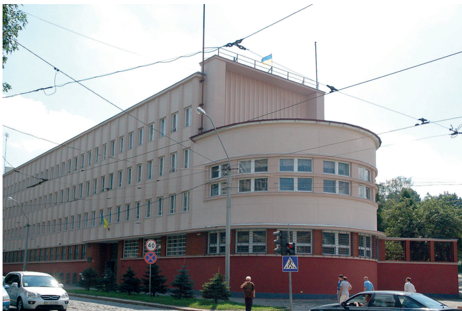
Il. 41. Budynek użyteczności publicznej Lwowskiej Szkoły Architektonicznej z końca lat 30 XX wieku – gmach Miejskich Zakładów Elektrycznych we Lwowie, róg ul. Kadeckiej (ob. Bohaterów Majdanu, ukr. Вулиця Героїв Майдану) i Pełczyńskiej (ob. D. Witowskiego 55, ukr. Дмитра Вітовського), 1935–37, proj. Tadeusz Wróbel i Leopold Karasiński.

Szereg ważnych pozycji dotyczyło XX-wiecznego Wołynia. Omówiono jego historię, odbudowę i architekturę 99 . Również międzywojenna architektura terenów północno-wschodnich wzbudzała coraz większe zainteresowanie 100 . Pisano o północnych kresach i Pomorzu 101 . Powstało też wiele opracowań poświęconych architekturze Poznania – mogą one stanowić odniesienie do zachodnich kresów 102 . W ostatnich latach ukazały się pierwsze publika-