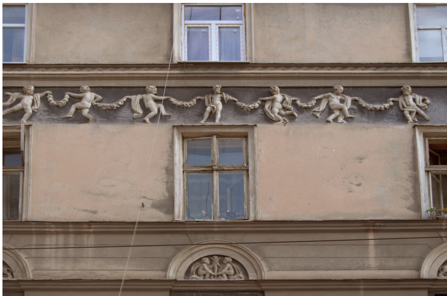
Il. 5. Klasycystyczna kamienica Lwowskiej Szkoły Architektonicznej, róg ul. Kościelnej (ob. Iwana Gonti 34, ukr. Івана Гонти) i Krakowskiej 34 (ukr. Краківська), fragment elewacji bocznej, pocz. XIX w., dekoracja rzeźbiarska Anton Schimser.

ców. Sandomierszczyzna obejmowała obszar budowanego u schyłku lat trzydziestych Centralnego Okręgu Przemysłowego 12 , sąsiadowała również z województwem kieleckim, gdzie działało i osiadło wielu wychowanków Politechniki Lwowskiej. Lwowiacy intensywnie budowali także na obszarze Wołynia i współtworzyli tamtejsze środowisko architektoniczne 13 .