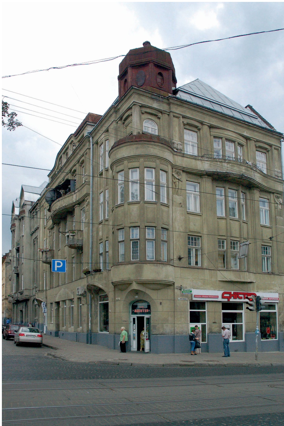
Il. 15. Typowa kamienica Lwowskiej Szkoły Architektonicznej z okresu wczesnego modernizmu – kamienica Sulima i Sabiny Schönfeldów, ul. Głowińskiego 2 (ob. Czernihowska, ukr. Чернігівська), 1912, proj. Ferdinand Kassler. Widok ogólny.