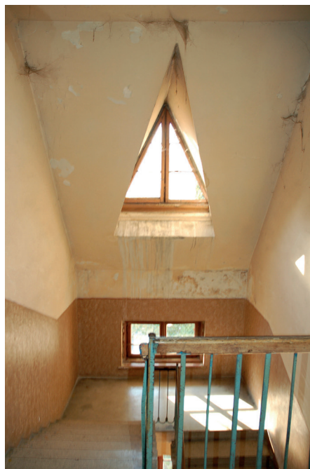
Il. 20. Jeden z pierwszych zespołów zabudowy spółdzielczej Lwowskiej Szkoły Architektonicznej z lat 20 – budynki Związku Mieszkaniowego i Budowlanego „Własna Strzecha”, ul. Nad Jarem 1–7, 9, 12, (ob. Energetyczna, ukr. Енергетична) na Persenkówce, proj. Władysław Klimczak, realizacja 1928–1931. A. Widok ogólny budynku nr 7; B.–C. Fragment elewacji i klatka schodowa budynku nr 1.