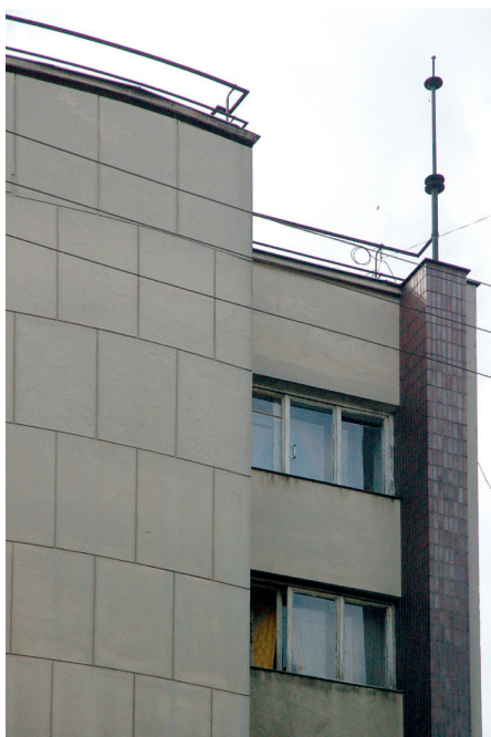
Il. 33. Jeden z ostatnich luksusowych budynków Lwowskiej Szkoły Architektonicznej wzniesionych przed II wojną światową, gmach Izby Notarialnej (zwany też Domem Notariuszy), ul. Romanowicza 6 (ob. P. Saksagańskiego, ukr. Панаса Саксаганського), proj. Zbigniew War-dzała w biurze Stanisława Różyckiego 1937–1938, realizacja do 1939 roku. A. Widok ogólny; B.–C. Fragment elewacji.