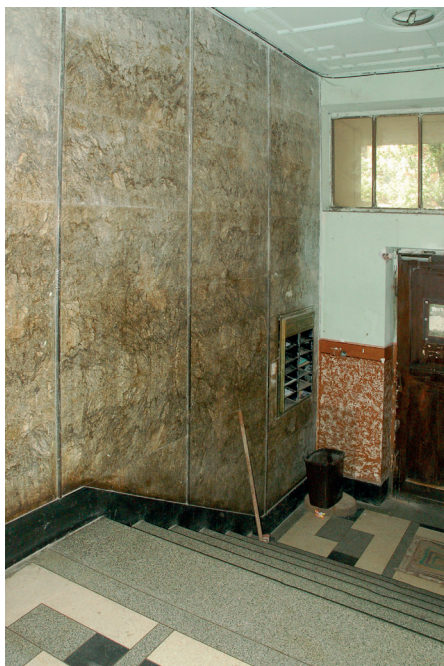
Il. 39. Typowe elementy budynków Lwowskiej Szkoły Architektonicznej – zaokrąglone ryzality elewacji, okładziny z marmurów z Żurawna, kolorowe lastryka we wnętrzach – kamienica przy ulicy Dąbrowskiego 7 (ob. Rutkowicza, ukr. Івана Рутковича). A. Widok ogólny; B. Fragment elewacji; C. Klatka schodowa.