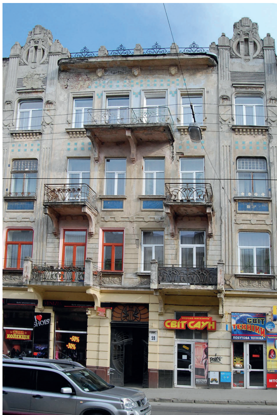
Il. 11. Typowe secesyjne kamienice Lwowskiej Szkoły Architektonicznej, ul. Iwana Franki 59. A. Widok ogólny, B. Górna część elewacji.