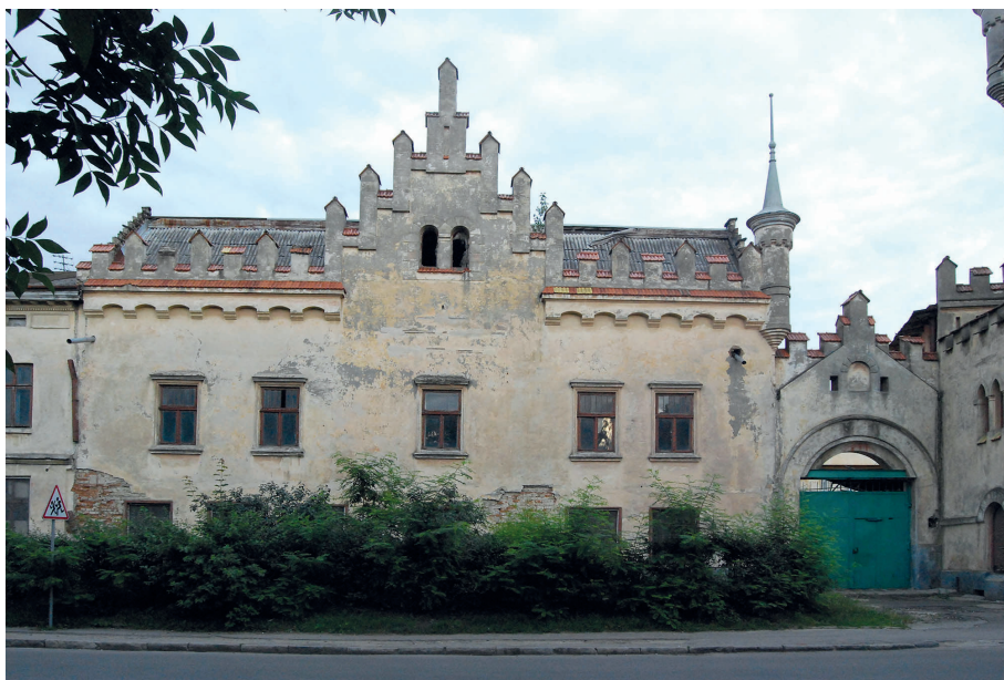
Il. 9. Typowy budynek w duchu historyzmu Lwowskiej Szkoły Architektonicznej – ul. Żółkiewska 124 (ob. Chmielnickiego, ukr. Богдана Хмельницького) przylegający do zespołu budynków fabryki Baczewskich.

niej. Liczne międzywojenne budynki Katowic i Śląska czy Poznania oraz budowle wznoszone na terenie Centralnego Okręgu Przemysłowego były inspirowane tą szkołą architektoniczną. Przedstawiciele środowiska lwowskiego działali na wielu obszarach pogranicznych, choć wpływy lwowskiej szkoły architektonicznej były największe na północnych i południowych kresach (Pomorze, Gdynia, Wileńszczyzna), dominowały zaś na wschodnich i zachodnich kresach (Śląsk, dawna Galicja).