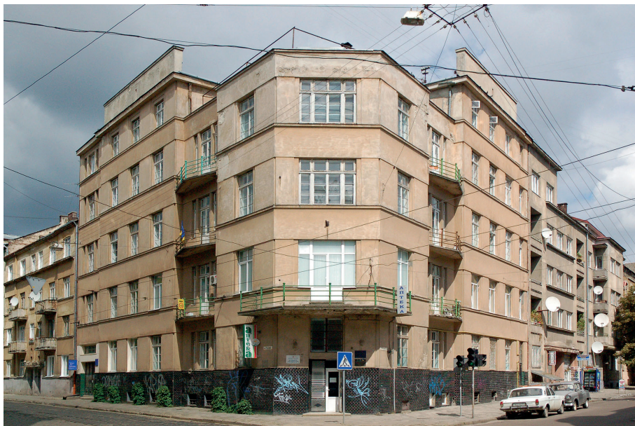
Il. 23. Jeden z wyróżniających się budynków Lwowskiej Szkoły Architektonicznej – Dom Emigranta, róg ulic 29 listopada 12 (ob. E. Kopowalca, ukr. Євгена Коновальця 12) i Wiśniowieckich 4 (ob. Rusowych, ukr. Русових), 1929–1930. proj. Henryk Zaremba.