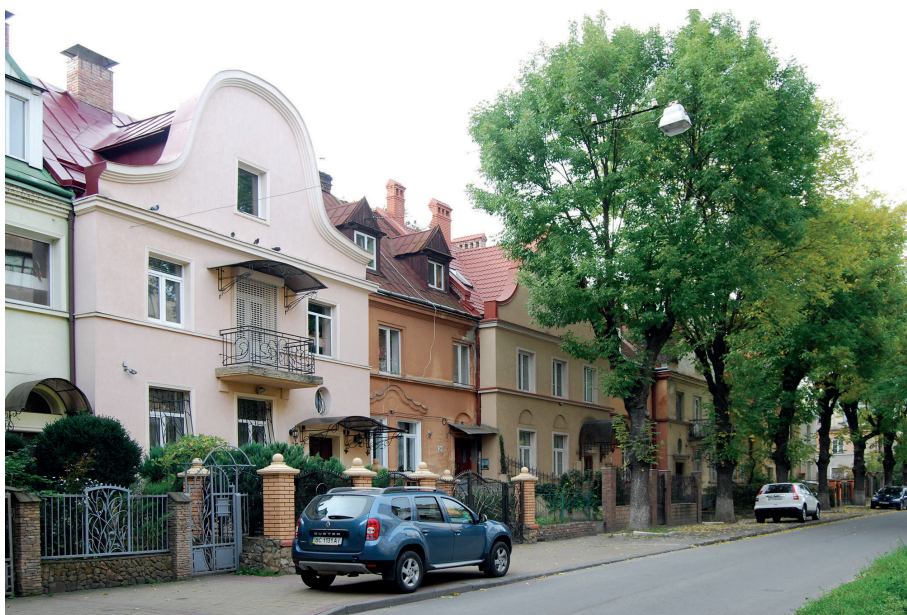
Il. 19. Przykładowe kolonie Lwowskiej Szkoły Architektonicznej – domy oficerskie w stylu dworowym łączonym z elementami wczesnego modernizmu. A. „Kolonja Oficerska” okręgu VI, ul. Oficerska 22–24 (ob. W. Samilejka, ukr. Володимира Самійленка), 1923, proj. Władysław Lembergen i Witold Jakimowski. B. Kolonia przy ul. Kaspra Voczkowskiego 25–27 (ob. Odeska, ukr. Одеська), 1924–1924. proj. Władysław Lembergen i Witold Jakimowski.