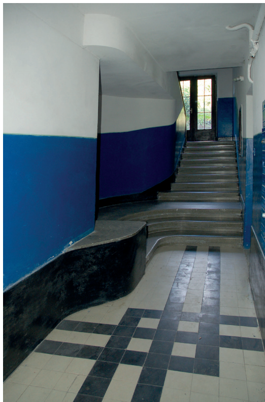
Il. 38. Najwybitniejszy budynek narożny naśladowujący willę Lwowskiej Szkoły Architektonicznej – dom Eugenii Lewickiej, ul. Raławicka 2 (ob. U. Samciuka, ukr. Уласа Самчука і об. Івана Франка 148, ukr. Івана Франка). proj. Ryszard Hermelin 1937, realizacja do 1938 roku. A. Klatka schodowa; B. Fragment terakotowej podłogi klatki schodowej.