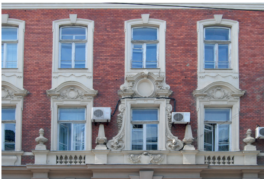
Il. 2. Dawny gmach Szkoły Przemysłowej, miejsca kształcenia budowniczych Lwowskiej Szkoły Architektonicznej, ul. Teatralna 17 (ukr. Театральна), proj. Gustaw Bisanz 1890, bud. 1890–1892. A. Widok ogólny; B. Środkowa część elewacji.