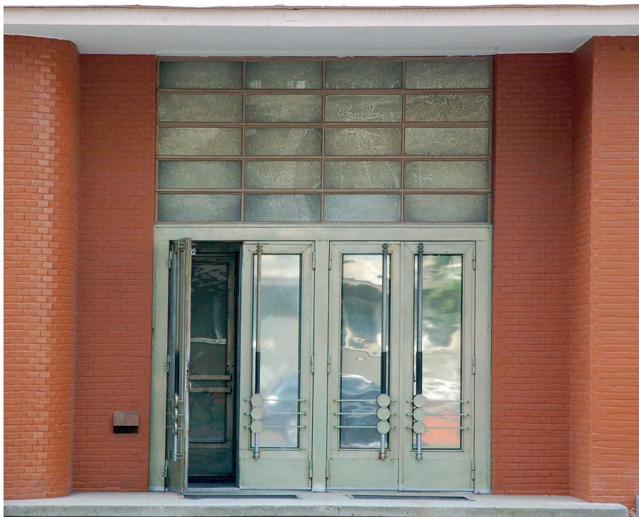
Il. 44. Przykład budynku Lwowskiej Szkoły Architektonicznej z rozbudowanym programem społecznym – Dom Związku Pracowników Gminnych Miasta Lwowa wraz z Kinoteatrem Światowid, ul. Samuila Kuszewycza 1 (obecnie ulica Serafyma Kuszewycza), 1933–1938, proj. Tadeusz Wrobel i Leopold Krasiński, główne wejście.

cje omawiające architekturę południowych kresów 103 . Architektura kresów i obszarów peryferyjnych została zauważona już w literaturze poświęconej twórczości na całym obszarze Środkowej Europy 104 . Prace te zawierają liczne analogie do dzieł Lwowskiej Szkoły Architektonicznej. Dowodzi to, że zakres zainteresowań twórczością Lwowskiej Szkoły Architektonicznej wciąż rozszerzał się i obejmował coraz to nowe obszary.