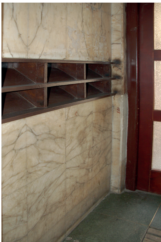
Pl. 28. Typowa funkcjonalistyczna kamienica Lwowskiej Szkoły Architektonicznej – ul. Domagaliczów 6, (ob. Pawłowa, ukr. Академіка Павлова). A. Widok ogólny; B. Strefa wejścia i skrzynka pocztowa.