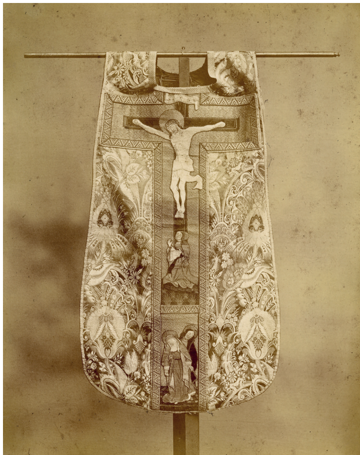
Il. 14. Pińsk, katedra. Ornat z haftem, koniec XVI w. Fot. przed 1939 r., Instytut Sztuki PAN.

rze haftowała jedwabiem z największym temu oddaniem 65 . Ten nadzwyczaj cenny zespół zachował się w pińskiej katedrze do dzisiaj (il. 14).