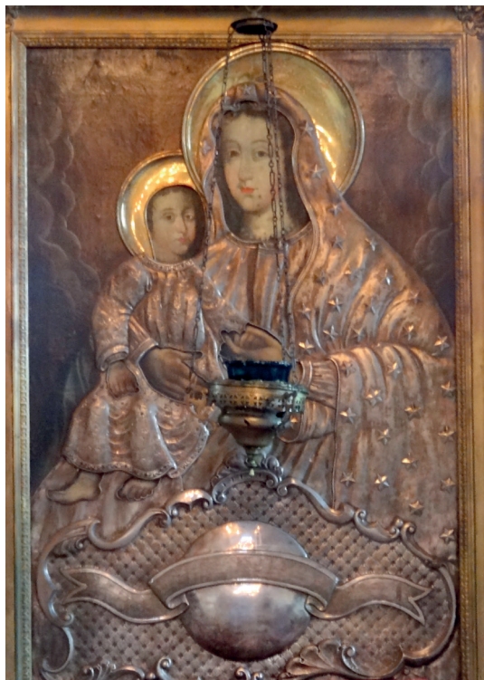
Il. 5. Obraz Matki Boskiej z kościoła, obecnie cerkwi prawosławnej, w Janowie. Fot. Z. Michalczyk.

był jako kino i magazyn – przekształcono wówczas wnętrze, które następnie uległo dewastacji.