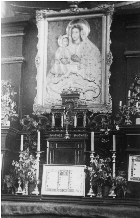
Il. 4. Janów Poleski, ołtarz z obrazem Matki Boskiej i relikwiarzem bł. Andrzeja Boboli. Fot. po 1926 r., Narodowe Archiwum Cyfrowe.

wany przez biskupa wileńskiego Wacława Żylińskiego 20 (il. 3). Obok kościoła wzniesiono również szpital.