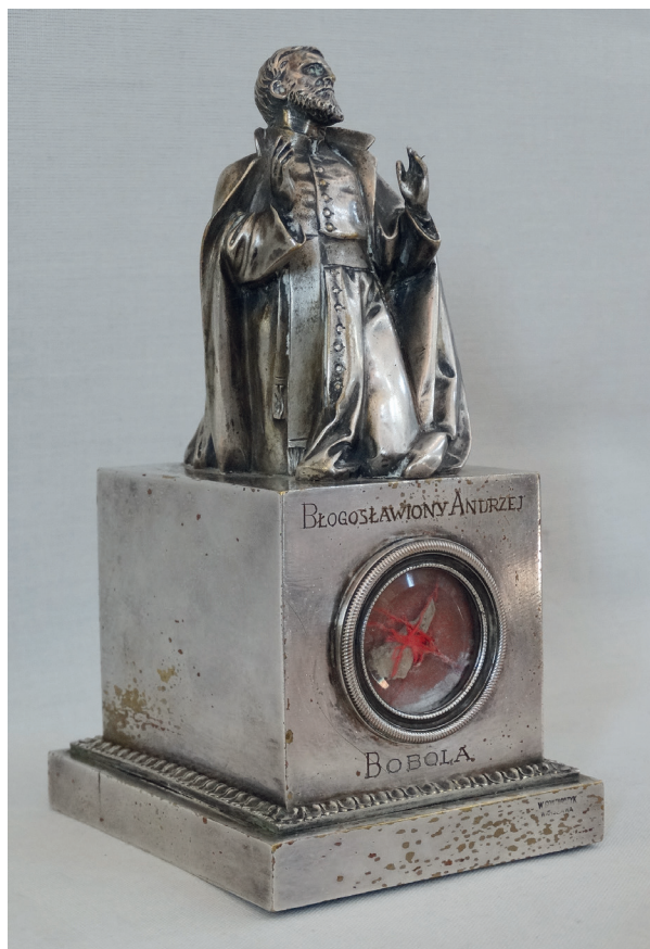
Il. 8. Pińsk, katedra. Relikwiarz św. Andrzeja Boboli, wyk. Wiktor Gontarczyk, przed 1937 r.

skrzynkowym relikwiarzu w formie prostokątnej trumienki o wybrzuszonych ściankach bocznych, z figurą klęczącego świętego na nakrywie. Relikwiarz ten znany jest dziś jedynie z fotografii 53 .