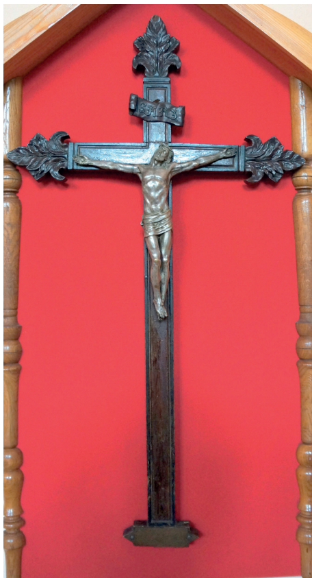
Il. 9. Janów Poleski, kościół parafialny. Krucyfiks, wyk. Helena Skirmunttowa, 1871 r., i Napoleon Orda, 1878 r.