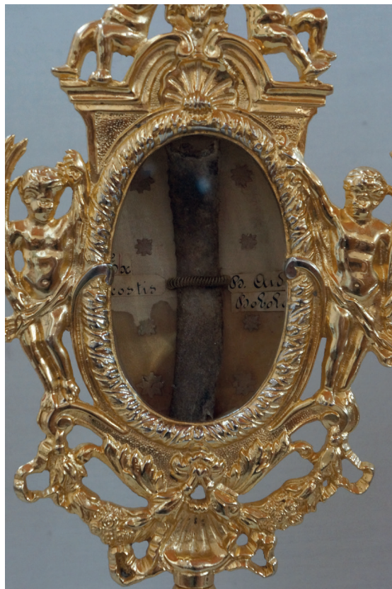
Il. 6. Janów Poleski, puszka z relikwiami św. Andrzeja Boboli.

obrzędki wschodniego na Kresach 37 . Jezuicy misjonarze neounicy z Albertyna czuli się jednak zapewne duchowymi spadkobiercami św. Andrzeja Boboli i jego misji nawracania prawosławnych, stąd ich rola w nabożeństwach w Janowie wydaje się szczególnie istotna.