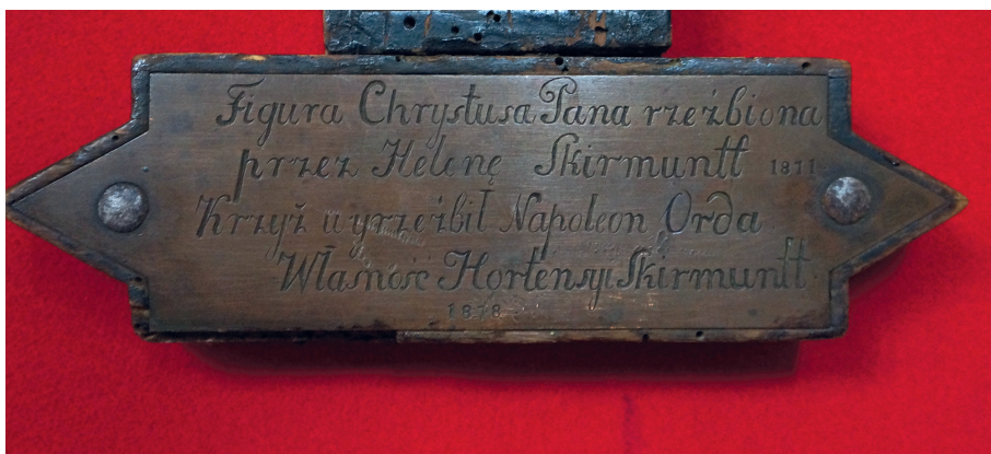
Il. 10. Janów Poleski, kościół parafialny. Tabliczka z krucyfiksu.