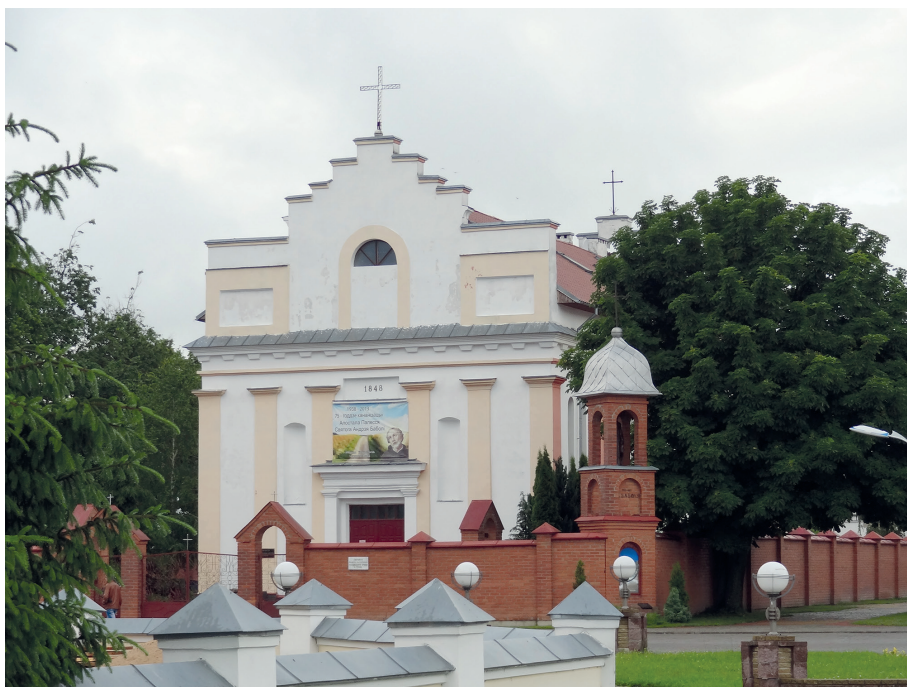
Il. 3. Kościół parafialny w Janowie Poleskim.

parafii, za miastem, usytuowany był cmentarz grzebalny, na którym stała niewielka, drewniana kaplica cmentarna. Zarówno cmentarz, jak i kaplica były użytkowane wspólnie z unitami – w 1828 r. wzmiankowano, iż kapłan unicki w razie potrzeby pomagał również proboszczowi w pełnieniu obowiązków kapłańskich 18 .