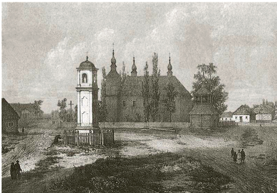
Il. 2. Janów Poleski, cerkiew unicka i kapliczka na miejscu śmierci św. Andrzeja Boboli. Litografia wg rysunku Napoleona Ordy z 1861 r.

Andrzeja Boboli 8 . Cerkiew unicka znajdowała się na rynku, w jej pobliżu wzniesiono później kościół rzymskokatolicki. Widoczna jest ona na litografii według rysunku Napoleona Ordy ukazującej rynek w Janowie 9 (il. 2). Po kasacie unii świątynia użytkowana była jako prawosławna. W 1904 r. wzniesiono na jej miejscu nową, murowaną cerkiew prawosławną, istniejącą do dziś.