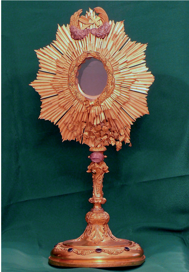
Il. 19. Drohiczyn, Muzeum Diecezjalne, monstrancja z kościoła parafialnego w Kwatyczach, wykonana przed 1833 r. przez Stephana Mayerhofera z Wiednia, stan w 2009 r.

[obraz] olejny stary , nieznanego pochodzenia, niewątpliwie jednak pierwotnie też związany z okolicznym terenem. Być może wizerunek z Secymina, który w pamięci mieszkańców Wołczyzna został utożsamiony z cudowną Matką Boską rodziny Czartoryskich, należy łączyć właśnie z tym dziełem.