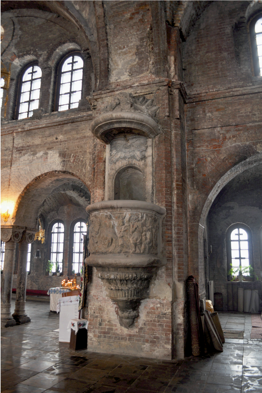
Il. 17. Brześć, kościół garnizonowy w twierdzy, obecnie cerkiew, ambona, 1928 r., stan w 2010 r.