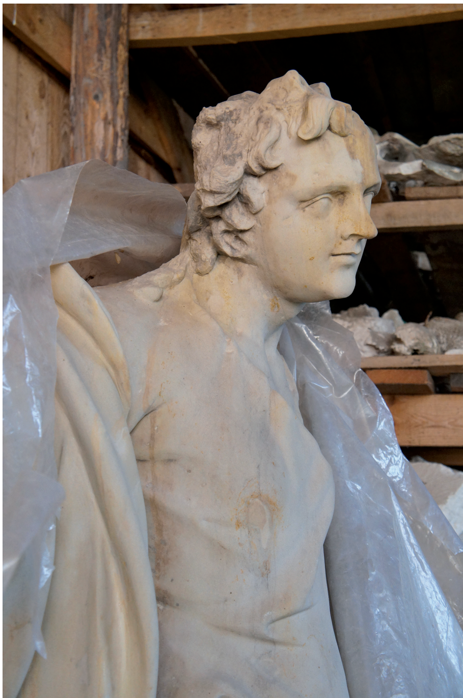
Il. 10. Rzeźba św. Jana Ewangelisty z przyczółka kościoła parafialnego w Wołczynie, wykonana przez J.Ch. Redlera ok. 1755–1758 r., stan podczas restauracji w 2012 r.