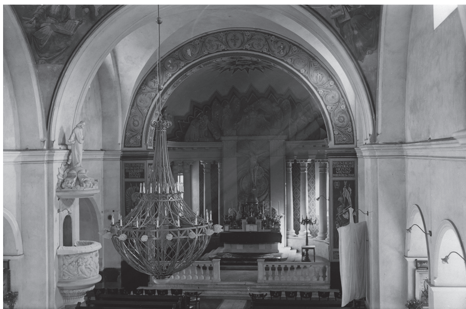
Il. 16. Brześć, kościół garnizonowy w twierdzy, widok wnętrza, stan przed 1939 r.

do nowo wzniesionego kościoła Trynitarzy w Rzyszczowie w diecezji kijowskiej. Co prawda, większość wyposażenia z Brześcia wysłano do Wilna, jednak okazało się, iż obie tamtejsze świątynie trynitarские posiadały już takie figury. Dziś, otoczona przed 1939 r. czcią figura ze Zbirohów, stoi całkiem zapomina w kruchcie kościoła parafialnego w Terespolu 14 . Podobnie cudowny obraz Matki Boskiej Wistyczej – ikona pochodząca z początku XVI w., w roku 1662 wymieniana przez Piotra Pruszcza pomiędzy najbardziej wenerowanymi w Rzeczypospolitej i opisywana przez Niemcewicza 15 – został dziś zdegradowany i pełni jedynie funkcję jednego z eksponatów muzeum przy klasztorze Cystersów w Szczyrzycu.