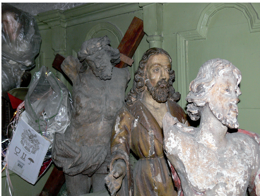
Il. 9. Rzeźby Chrystusa, wiek XVII–XVIII, w katedrze w Pińsku, stan w 2008 r.

Zupełnie nieodnotowanym przez literaturę obiektem jest klasztor Marianów w Raśnej, wzniesiony w 1749 r. i całkowicie zburzony w dobie „chruszczowowskiej” pod pretekstem przeprowadzania linii kolejowej, a znany jedynie z kilku fotografii. Było to założenie osiowe, z dominującą bryłą kościoła ujętą parterowymi skrzydłami klasztorными, nieco cofniętymi względem fasady świątyni, z poprzedzającym czworobocznym murem z wewnętrznymi niszami zawierającymi malarskie przedstawienia stacji Męki Pańskiej oraz narożnymi kaplicami dla Procesji Bożego Ciała 6 . Takie rozwiązanie genetycznie wypływa z krążankowych założeń typowych przede wszystkim dla kościołów reformackich (najbliższy geograficznie przykład – w Białej Podlaskiej) oraz bernardyńskich. W zbliżonym czasie (1761 r.) podobne ogrodzenie ze stacjami Męki Pańskiej (ale bez narożnych kaplic) zastosowano w kościele Trynitarzy w Brześciu Litewskim. Proste, bezpodziałowe elewacje raśnieńskiej świątyni wydają się bliskie dziełom środowiska warszawskiego pierwszej trzeciej wieku XVIII.