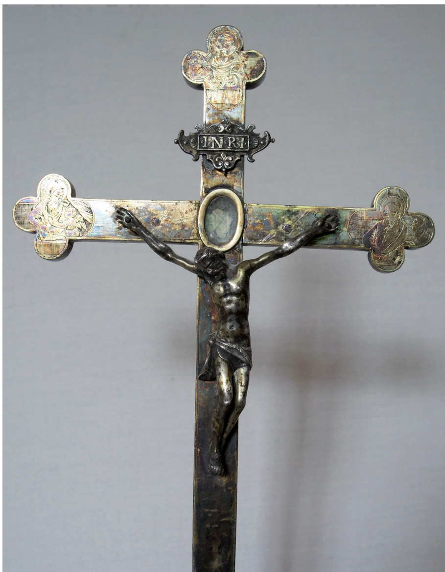
Il. 18. Siehniecicze, kościół parafialny, pacyfikał, ok. połowy XVII w., stan w 2012 r.

szczególnym kultem rodziny Czartoryskich, w aurze cudownego. Owa kopia miała zostać umieszczona w odzyskanym kościele, a po roku 1945 wraz z repatriantami trafiła do Secymina. Jednak inwentarze wołczyńskiego wyposażenia z 1928–1936 nie odnotowały obecności ani tej „kopii”, ani oryginału, natomiast w dokumencie z roku 1936 pojawiło się Ukoronowanie Najśw. M.P.