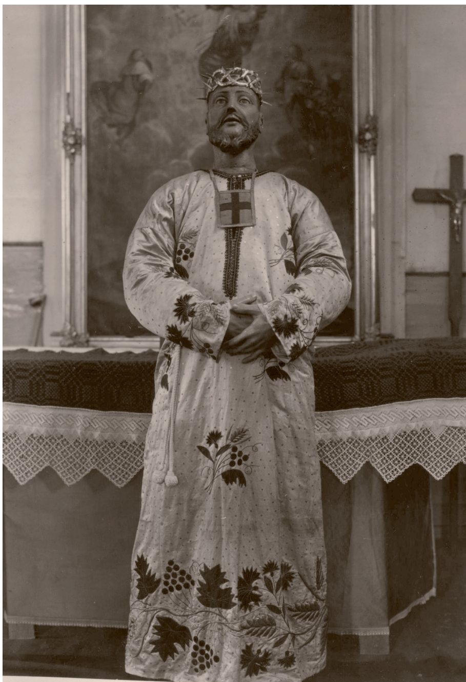
Il. 7. Rzeźba Chrystusa Trynitarzkiego w kościele parafialnym w Zbirohach (ob. w Terespolu), stan w 1929 r.