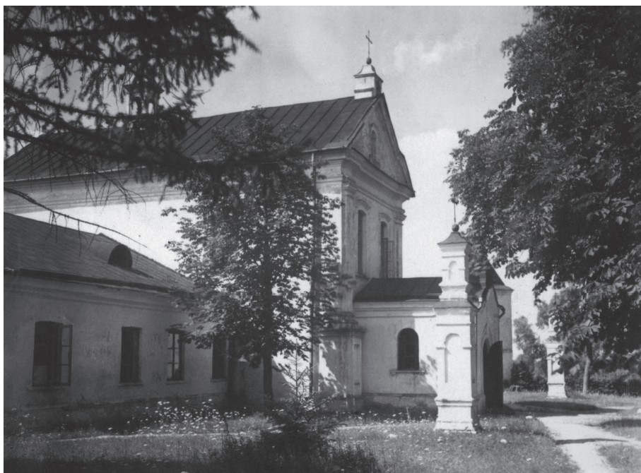
Il. 4. Kościół Marianów w Raśniej, stan w 1929 r.