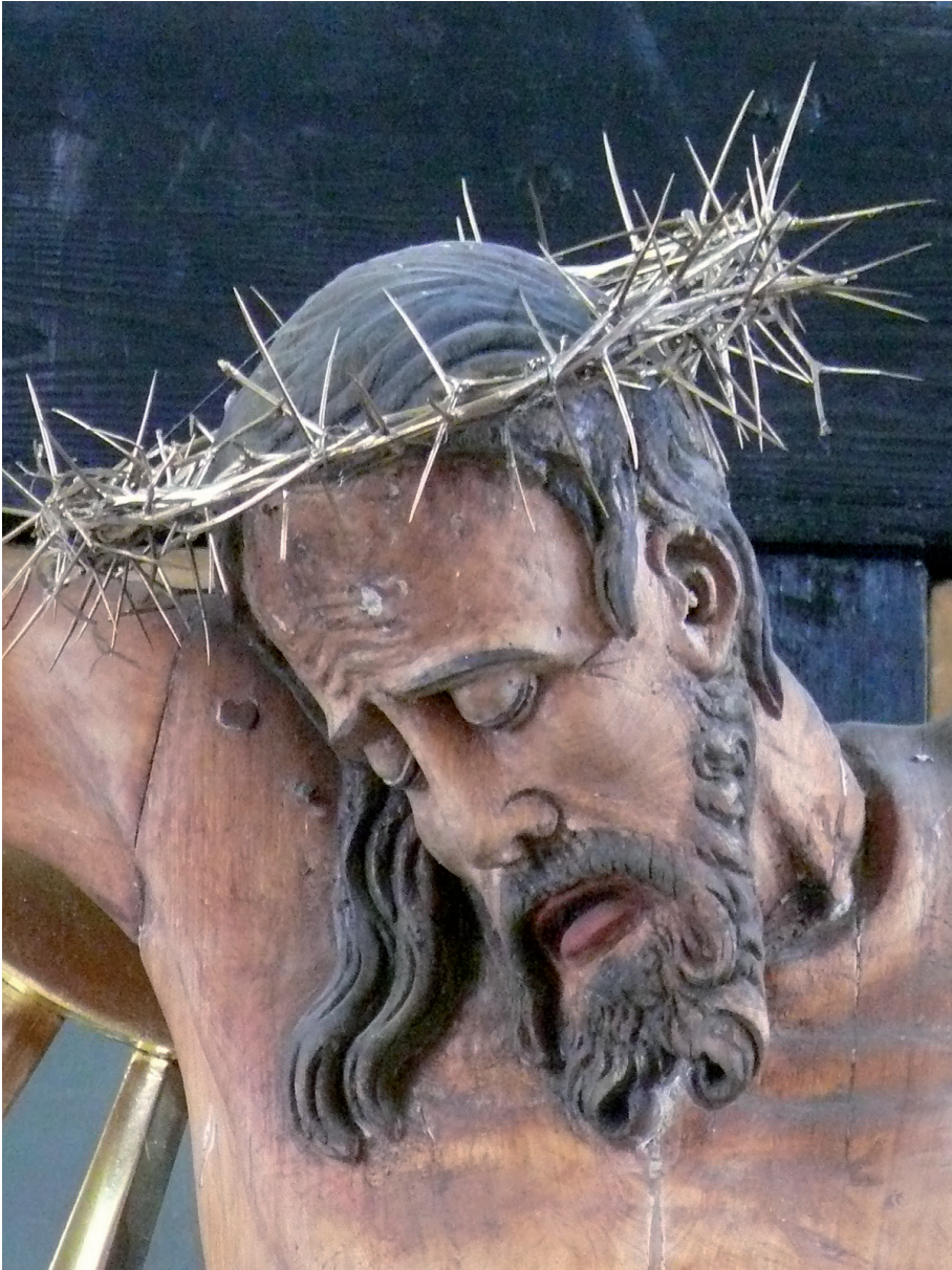
Il. 8. Fragment rzeźby Chrystusa Ukrzyżowanego w kościele parafialnym w Czarnawczycach, początek XVII w., stan w 2008 r.