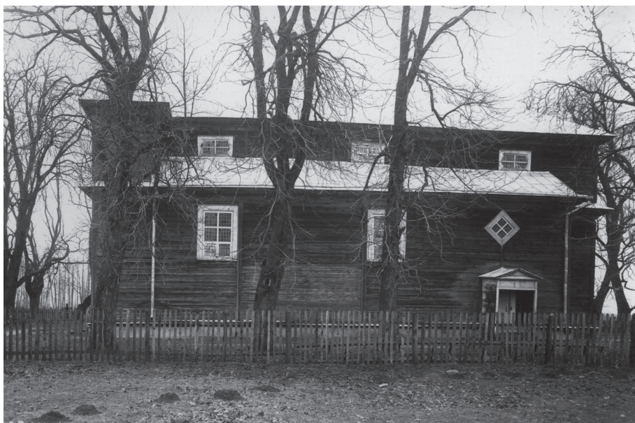
Il. 6. Kościół parafialny w Zbirohach, stan w 1929 r.