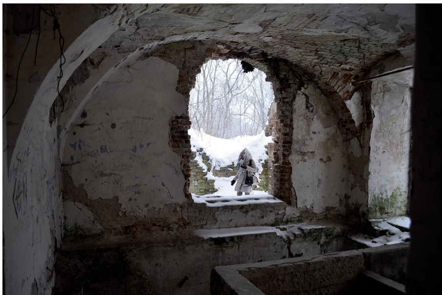
Il. 3. Ruiny klasztoru Bernardynek w Brześciu, stan w grudniu 2008 r.