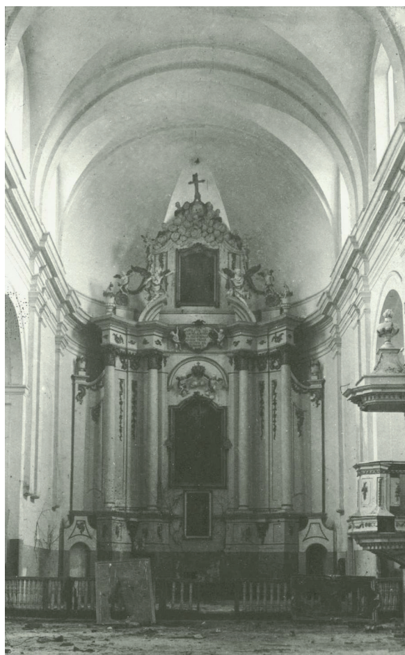
Il. 14. Wistycze, dawny kościół Cystersów, widok wnętrza ku prezbiterium, stan przed 1939 r.

w Brześciu w okresie międzywojennym istniało interesujące środowisko architektoniczne, zupełnie nieznane polskiej historii sztuki i tym bardziej zasługujące na dalsze badanie.