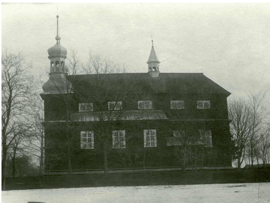
Il. 5. Kościół parafialny w Kamieńcu Litewskim, stan przed pożarem w 1924 r.