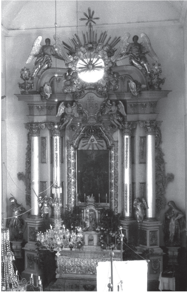
Il. 15. Kobryń, kościół parafialny, ołtarz główny z kościoła Cystersów w Olizarowym Stawie, stan w 1929 r.

a następnie po 1945 r. trafiły różne elementy wyposażenia gromadzone ze skasowanych okolicznych świątyń.