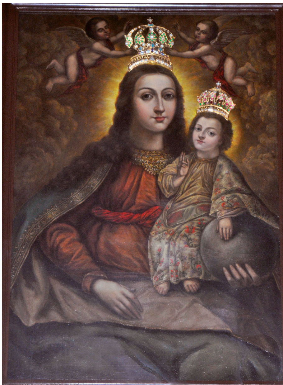
Il. 12. Obraz Matki Boskiej z Dzieciątkiem, początek wieku XVII, kościół parafialny w Secyminie-Nowinach (woj. mazowieckie), być może z Wołczyna, stan w 2013 r.