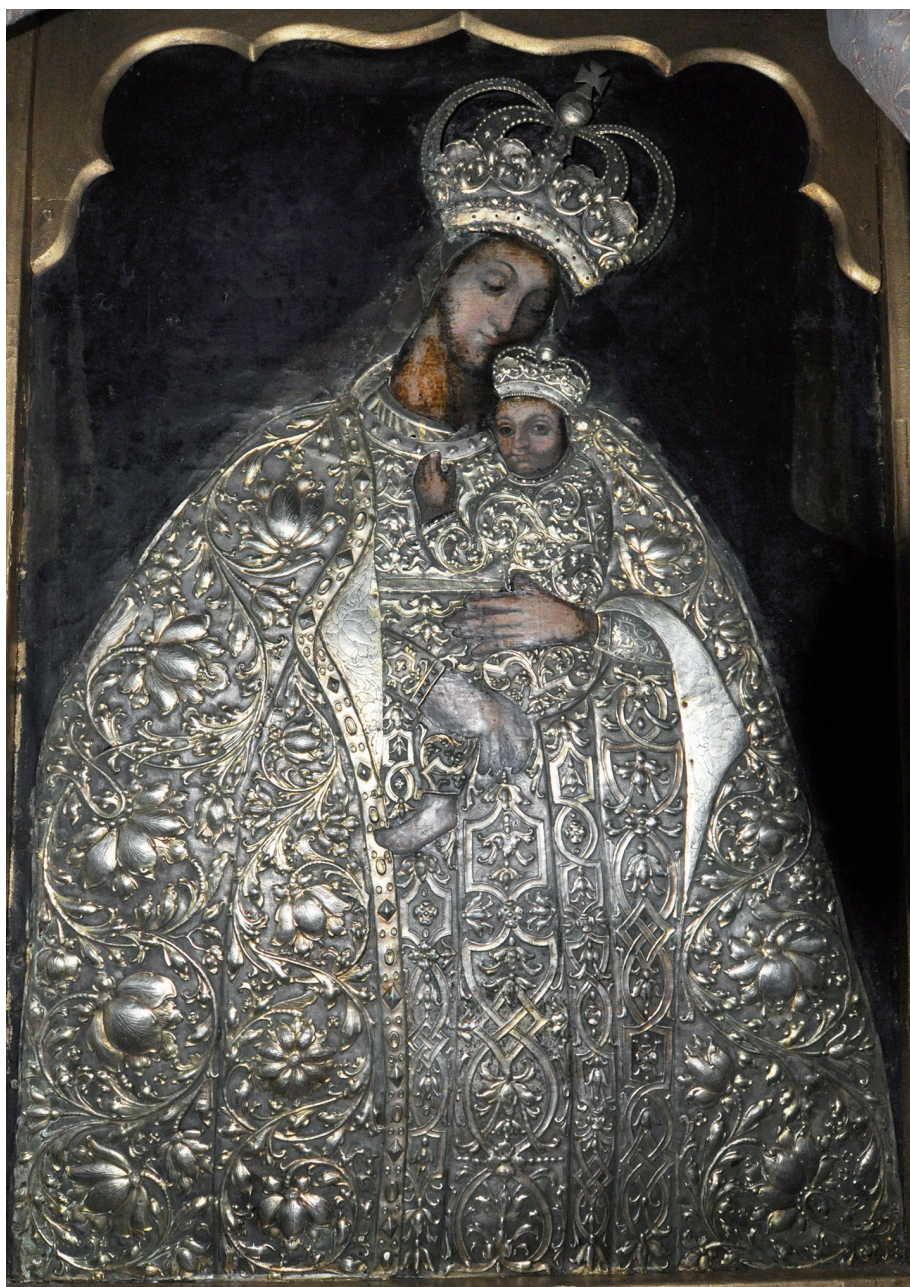
Il. 11. Obraz Matki Boskiej Ochowskiej, dawny kościół parafialny (obecnie cerkiew) w Ochowie, początek wieku XVIII, stan w 2012 r.