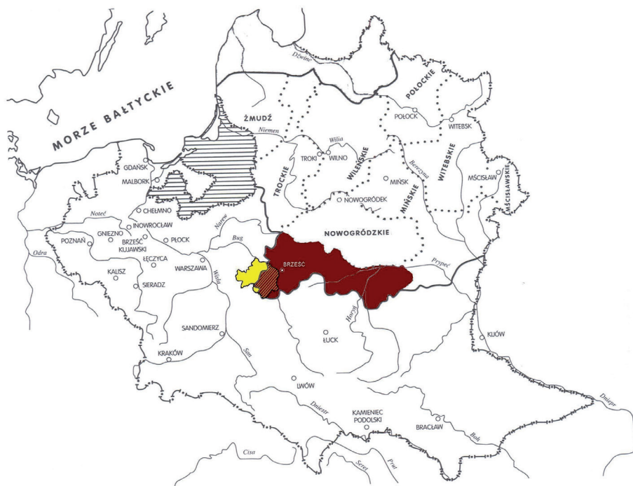
Il. 1. Województwo brzesko-litewskie w I Rzeczypospolitej (żółtym kolorem zaznaczony teren obecnego powiatu białskiego).

Pierwszy tom, poświęcony świątyniom Brześcia i okolic, został już złożony do druku. Ekspedycjom badawczym towarzyszyły możliwie najszerszej zakrojone kwerendy archiwalne w zasobach krajowych i zagranicznych. Udało nam się dotrzeć do wszystkich istniejących świątyń oraz do większości miejsc po obiektach unicestwionych, gdzie wykonaliśmy dokumentację fotograficzną. Pozyskaliśmy szeroki, w znakomitej większości nieznanym badaczom, a tym samym niepublikowany zespół archiwaliów z XVI–XX w., zwłaszcza akt wizytacji i opisów inwentarzowych, planów, pomiarów i projektów, materiałów ikonograficznych. Ponadto – a może przede wszystkim – mamy głębokie przekonanie, że udało się nam dokonać prawdziwych odkryć i wysunąć atrybucje, które – jak sądzimy – w znacznym stopniu uzupełniają obraz sztuki dawnej Rzeczypospolitej.